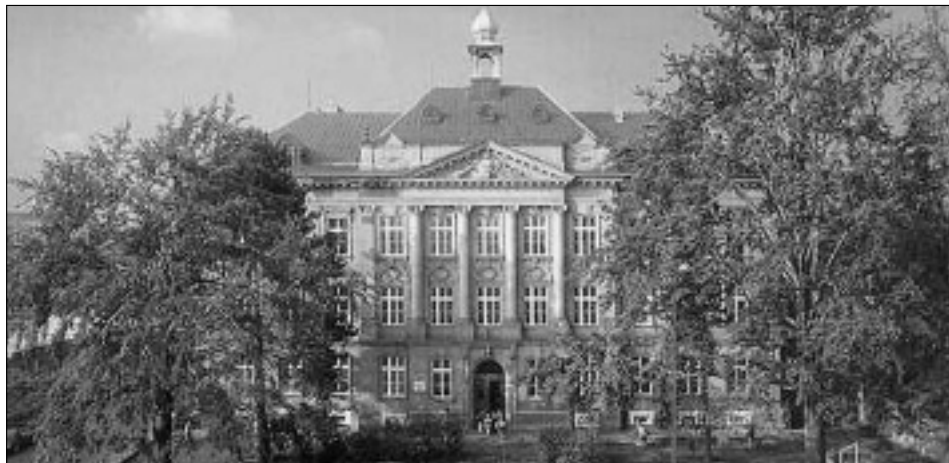
Základní škola na T. G. Masaryka se dočká nové fasády. Původně vyšší reálná škola byla otevřena v roce 1897.

a hospodaření města z nich zastupitelstvo bude postupně vybírat podle důležitosti a finančních možností jejich zajištění. Jsou zde např. opravy základních škol (II. etapa opravy II. ZŠ, kotelná III. ZŠ a další), oprava fasády a ozvučení sálu kina Vesmír, klimatizace v divadle Trám, chodník v Lačnově, rozvody koupaliště, zkapacitnění mostů na řece Svitavě, protipovodňová opatření na ulici Hádkově, rozšíření příjmu infokanálu atd. Zařazení dalších zde uvedených akcí je závislé na případném získání státní dotace, která by měla činit větší díl z potřebných prostředků. Je to například výstavba třetí „městské vily“ a první dvanáctibytové sekce dalšího obytného domu Na Vějíři, oprava Červeného kostela, rekonstrukce nádrže v lokalitě „Hájek“, odvodnění v lokalitě „Kostelní luka“, opravy budov Lanškrounská 5 a T. G. Masaryka 25.