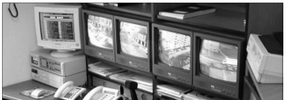
Monitory kamerového systému na službě městské policie.

Občany, které tato problematika zajímá, zveme na veřejné zasedání Zastupitelstva města Svitavy, které se bude konat 13. února od 14 hodin ve velké zasedací místnosti MěÚ, T. G. Masaryka 25.