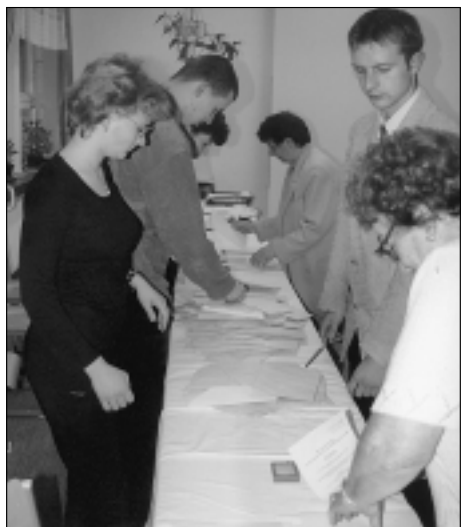
Volby do Senátu v roce 2000: Jedna z okrskových volebních komisí začíná počítat výsledky.

Letošní rok bude pro celý odbor velice náročný, protože nás čekají dvoje volby. Jednak to budou v červnu volby do Poslanecké sněmovny Parlamentu ČR, v listopadu pak volby do obecních zastupitelstev. Nově schválený zákon o volbách do obecních zastupitelstev mimo jiné významně upravil způsob podávání, prověřování a registraci kandidátních listin. Podle nového zákona je veškerá agenda v režimu výkonu státní správy, tzn. že kandidátní listiny nebudou registrovány na obecních úřadech, ale na pověřených obecních úřadech. Výjimkou jsou obecní úřady, kde jsou zřízeny alespoň dva odbory. Pro náš odbor to znamená, že budeme registrovat kandidátní listiny pro dvacet pět obcí, které spadají do našeho správního obvodu, a losovat pořadí volebních stran na hlasovacích lístcích. Pro tyto obce budeme zajišťovat rovněž tisk hlasovacích lístků.