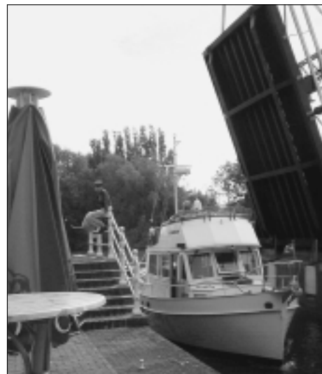
Partnerské město Weesp - jeden z mnoha zvedacích mostů

Na úseku školství připravujeme společně s odborem městského stavitele plán investičních akcí a údržby školských zařízení. Letošní největší akcí bude první etapa opravy fasády Základní školy na T. G. Masaryka, jejíž rozpočet se blíží ke třem milionům, druhá etapa opravy proběhne příští rok. Pokračují práce na opravách prostor po Pedagogicko psychologické poradně, kde vznikají prostory pro nulté ročníky speciální školy. Dále chystáme vyhlášení ankety sportovec roku a začínáme připravovat oslavy desátého výročí podepsání smlouvy o partnerských vztazích s holandským městem Weesp, které připadají na letošek. V běhu jsou také přípravy na konkretizaci a podpis partnerské smlouvy s Okresním úřadem v Banské Štiavnici, čekáme jejich návštěvu ve Svitavách.