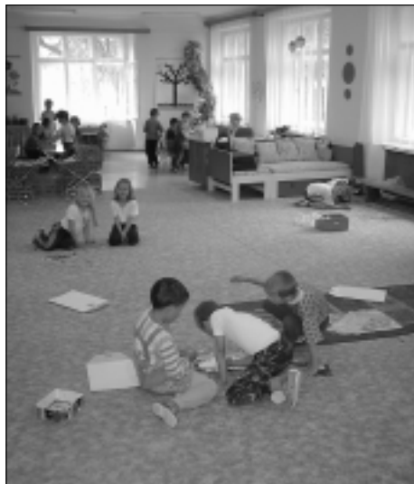
Interiér mateřské školy Úvoz 1