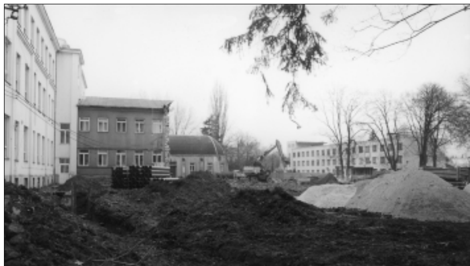
Netradiční pohled na svitavskou nemocnici, která v letošním roce a letech následujících projde velkou rekonstrukcí za téměř tři sta milionů korun. Podrobnosti uvedeme v příštím čísle Našeho města.

Informace: středisko LIKO SVITAVY a. s., Tolstého 13, tel./fax 54 10 14.