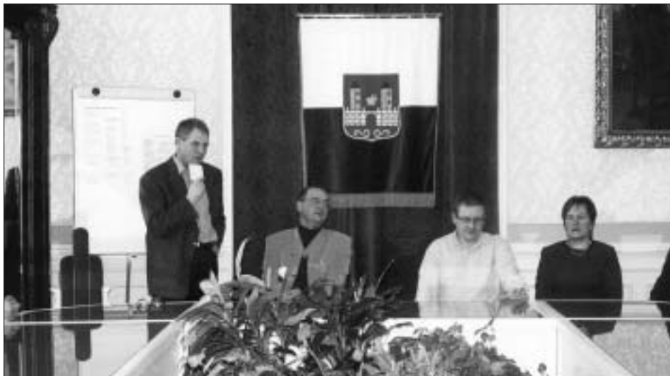
Setkání se zúčastnil i hejtmán Pardubického kraje Roman Línek (druhý zleva).

Starosta Václav Koukal využil přítomnosti hejtmána také k tomu, aby se s ním poradil, jak pomoci regionu Svitavska, který v rámci republiky patří mezi hospodářsky velmi slabé.