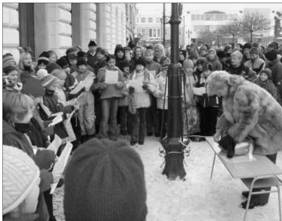
Z fotoarchivu základní školy na náměstí Míru: Zpívání u vánočního stromu 19. 12. 2002