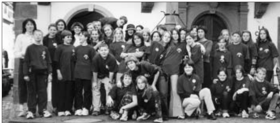
Evropské setkání hudební mládeže ve Weinheimu (2001)

Svaz postižených civilizačními chorobami pořádá o letních prázdninách putovní tábor