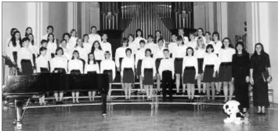
Gaudium v Koncertní síni v Uničově (1999)

Milí přátelé, pěvecký sbor svitavského gymnázia Gaudium slaví letos již své desáté narozeniny. V souvislosti s tímto významným jubileem Vám předkládáme několik informací, jež mapují dosavadní činnost tohoto pěveckého tělesa.