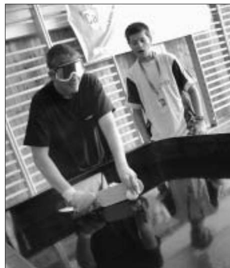
Show-down se hrál v tělocvičně ZŠ Felberova.

Připravili: M. Sezemská a J. Petr (Pozn.: K Olympiádě se ještě vrátíme v příštím čísle Našeho města a uvedeme podrobnosti.)