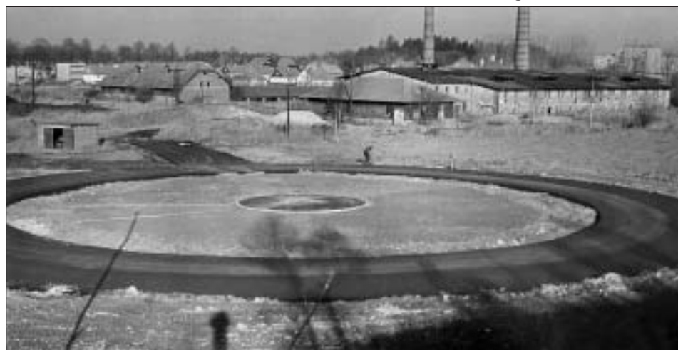
Modelářský stadion na cihelně v roce 1980.