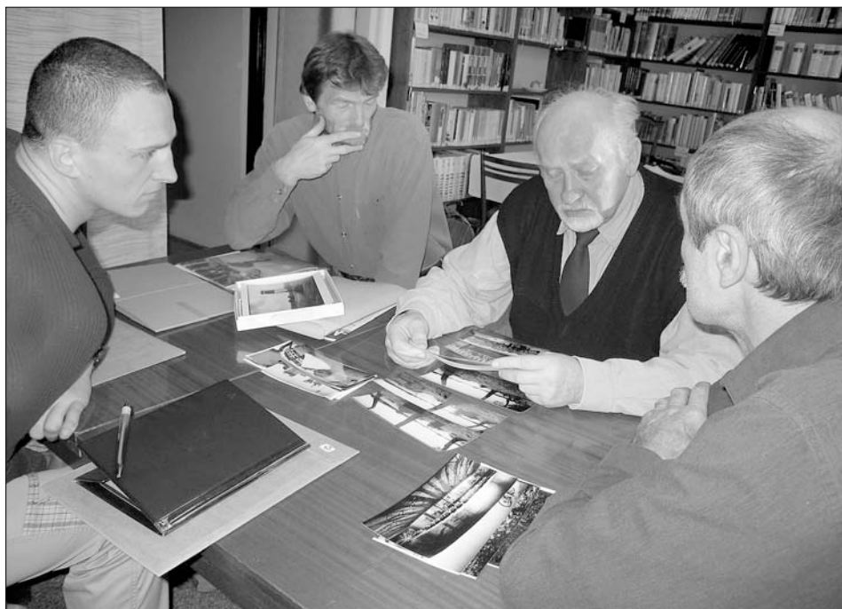
Workshop s panem Huckem - druhý zprava, během kterého diskutují členové fotoklubu nad fotografiemi o Svitavách.