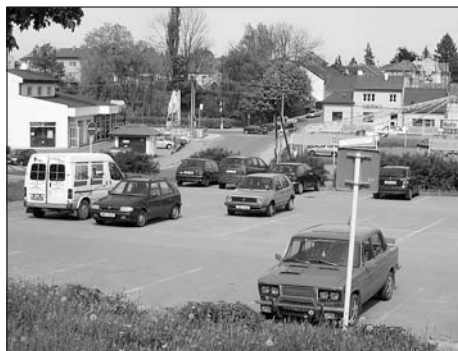
Parkoviště před prodejnou COOP - lepším využitím všech parkovacích míst se nešvarům vyhneme.

Odbor dopravy řešil několik stížností na parkování těžkých nákladních vozidel (kamióny, domíchávače...) na místních komunikacích. Ve stádiu úvah je proto omezení stání těchto vozidel vyhláškou města, podobně jako je to v některých okolních městech (Pardubice, Zábřeh, Moravská Třebová a dalších).