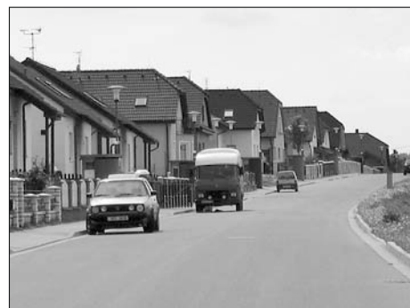
Na Vějíři - další příklad špatného parkování v obytné zóně, kde je možné parkovat jen na vyhrazených místech.