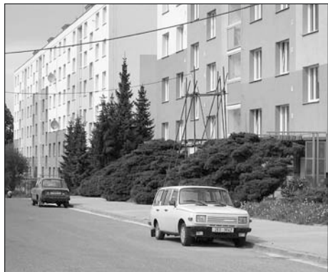
Ulice Větrná - rozšířený nešvar - parkování v protisměru.

Parkování je problém, se který se potýkájí snad všechna města. Je třeba si uvědomit, že město má svůj historický a urbanistický vývoj několik století, ale motorizmus do tohoto vývoje zasahuje až v posledních sto letech (první automobily se v Čechách vyrábějí od roku 1905), a výrazněji v posledních deseti letech.