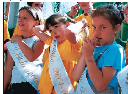
Ošerpované prvňáčky a ošerpovaní prvňáčci ze základní školy Riegrova byli chvíli v rozpacích.

Ve stejný den vyměnily lavice za sportoviště děti ze Základní školy na náměstí Míru. Na stadionu se utkaly ve všech možných disciplínách ve školní olympiádě. -zc-