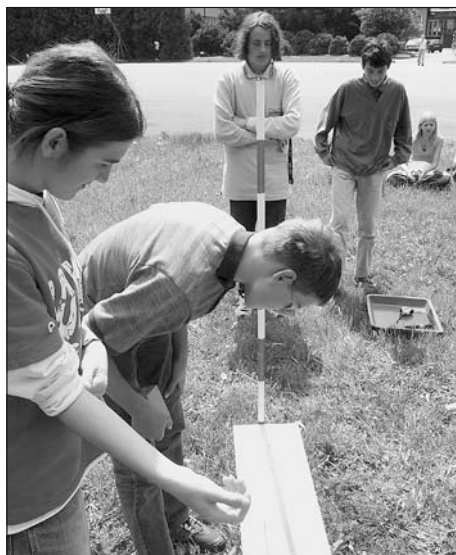
Žáci ZŠ Sokolovská při měření.