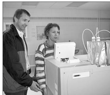
Účastníci mezikrajských dnů si prohlédli oddělení klinické biochemie Nemocnice Svitavy.