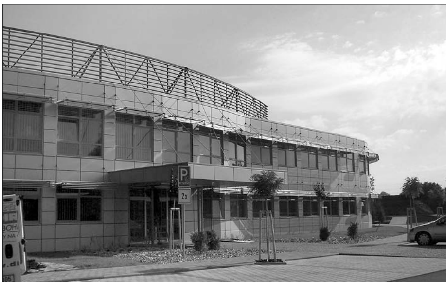
Během několika měsíců vyrostl v průmyslové zóně Paprsek tento moderní závod Fibertexu.