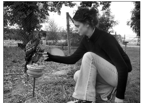
Studenti z Banské Štiavnice předvedli cvičené dravce.