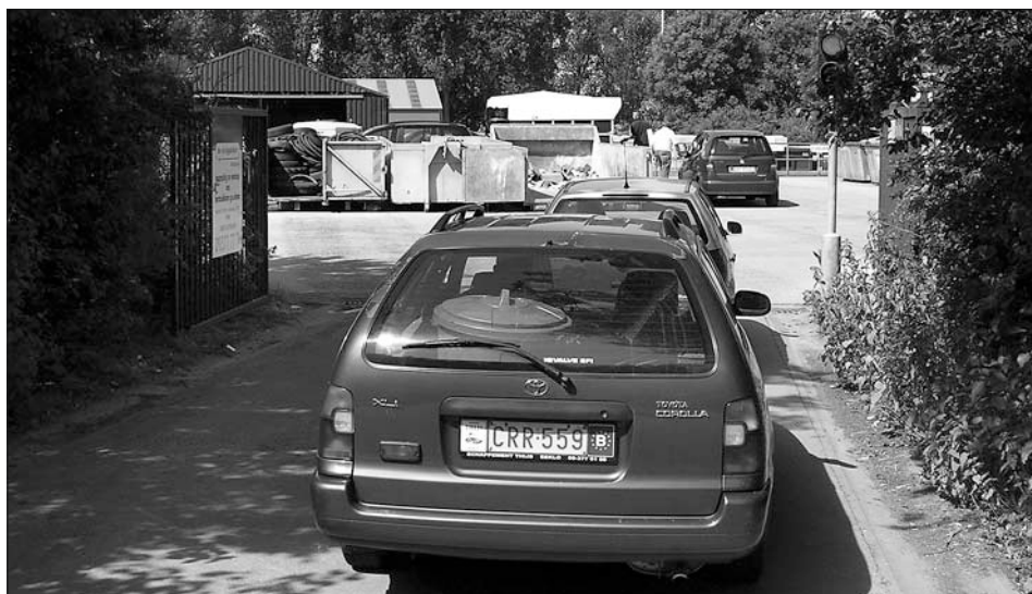
Sběrný dvůr ve městě Eeklo.

• Bude zajímavé sledovat, zda sledování indikátorů bude ve Vlámku probíhat i po ukončení financování tohoto projektu z vládních prostředků. Vzhledem k finančním možnostem měst lze v našich podmínkách stěží počítat s tím, že bude možné v blízké době financovat takové projekty, jako středisko ekologické výchovy v Antverpách, přestavby nevyužitých objektů na restaurace, využívané k rekvalifikačním kurzům ve všech navštívených městech, nebo volnočasových aktivit, které jsme viděli ve městě Ronse.