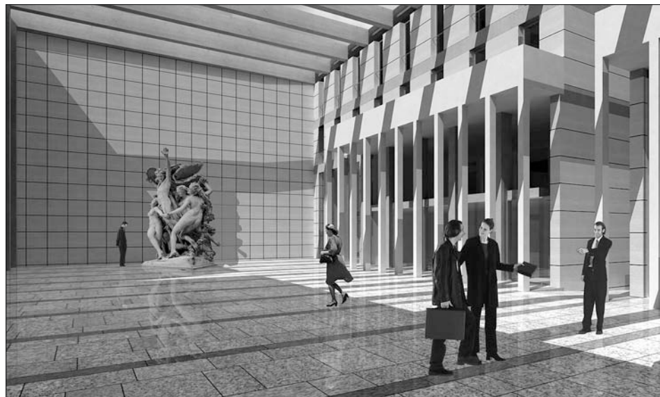
Projekt hotelu počítá s foajé, obchody a průchodem do Wolkerovy aleje.