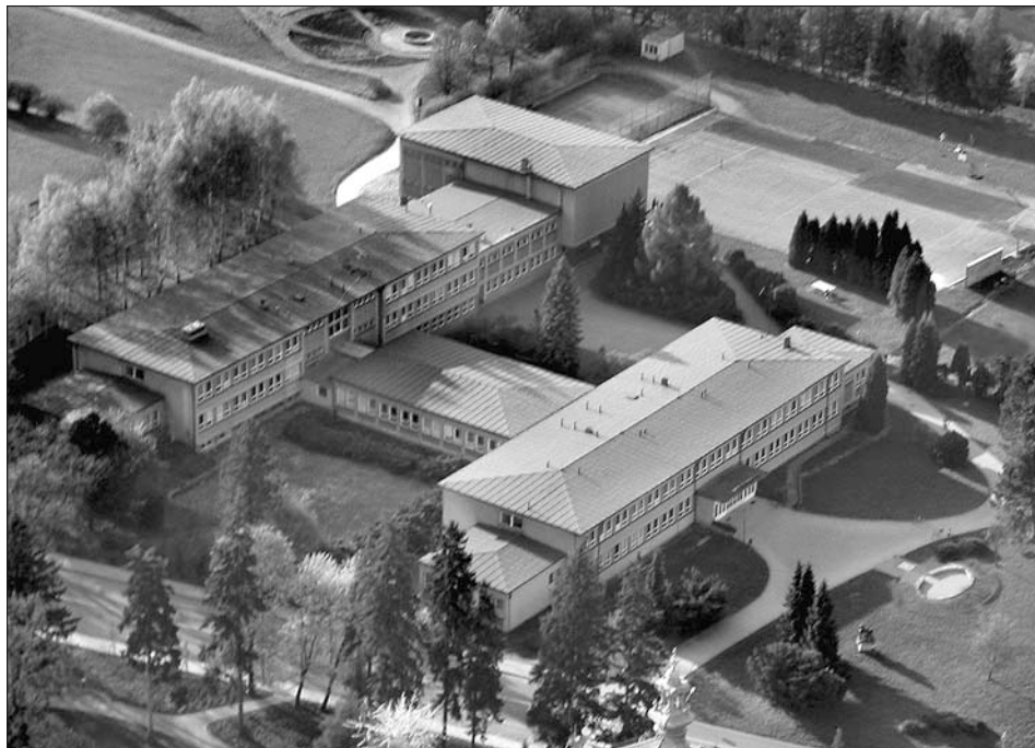
Letecký pohled na objekt gymnázia, v jehož areálu bylo vybudováno nové hřiště.