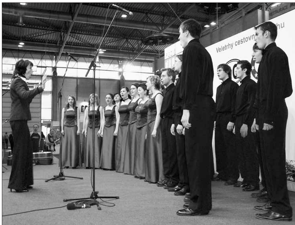
Při půlhodinové prezentaci Svitav zazpíval pěvecký sbor Iuventus.