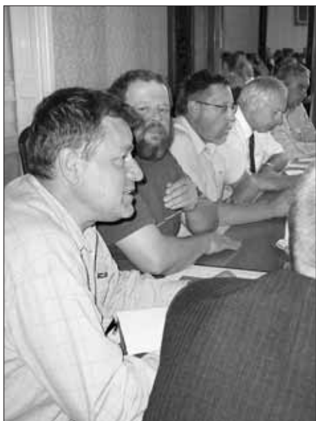
Starostové dotčených měst při jednání.