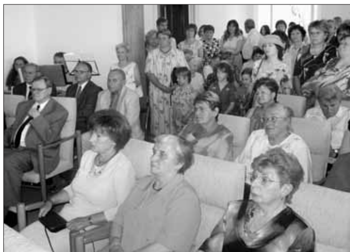
Správní rada Univerzity třetího věku a učitelé se setkali s absolventy při slavnostní promoci v obřadní síni.