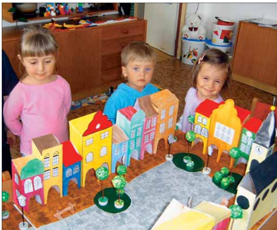
Děti z mateřské školy Větrná se pyšní svým dílem.