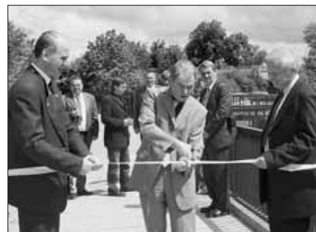
Slavnostní stříhání pásky při předávání I. etapy protipovodňových opatření na Lačnovském potoce 7. 6. 2006.

Investorem byla Zemědělská vodohospodářská správa s. p. a náklady dosáhly