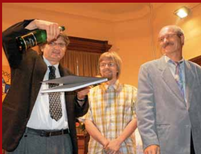
... A slavnostní křest knihy svitavských fotografů „Svitavy – město v pohybu“.