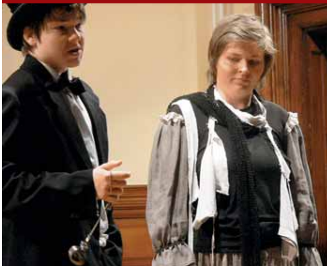
Sobotním odpoledním pořadem v Ottendorferově domě provázeli herci Dramatické školičky. Neústupný pan Čas (vlevo) plnil svoji roli a spolu s kněžnou Svatavou, Brunem, Štěstím, Bídou, Vlastí, Domovinou, Mírem a Nadějí se hráli v patnácti minutách historii Svitav.