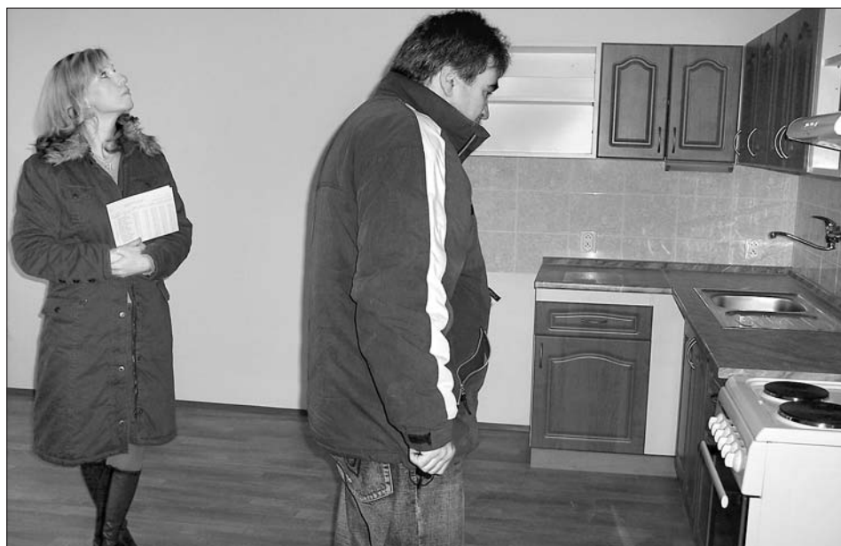
Nové byty si prohlédli i členové bytové komise města.