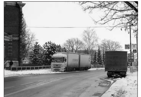
Kamiony dosud parkují před muzeem.