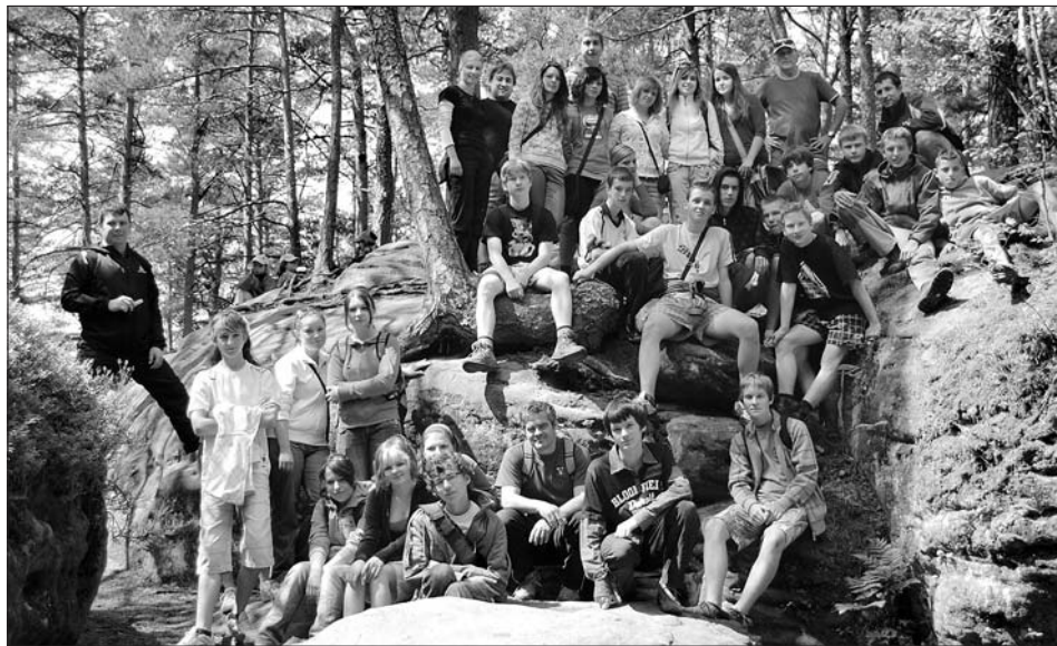
Společné foto z výletu se slovenskými přáteli do Toulouvcových maštálí.

V letošním školním roce měli žáci školy (ZŠ Sokolovská) možnost navštívit naši partnerskou školu na Slovensku ve Spišském Bystrém. Z několikadenního výměnného pobytu se vrátili nadšení. Získali nové kamarády a přesvědčili se, že se celkem bez problémů s přáteli na Slovensku dorozumí.