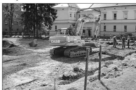
Stavební práce v ZŠ Riegrova.