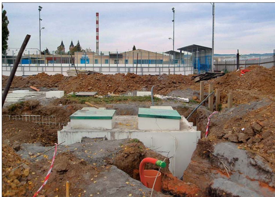
Nedodržení bezpečnostních pravidel by si dovolil opravdu jenom hazardér.