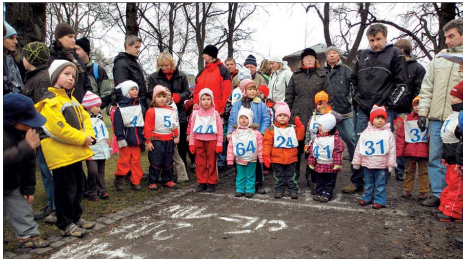
Na startu jsou připravena děvčata v kategorii 2006 a mladší.

než samotný běh. Avšak i tato prověrka dopadla dobře a do cíle doběhli všichni, kteří se postavili na start. Všechny potěšilo nejen nezvyklé prostředí parku, ale i příjemná atmosféra, kterou si účastníci vzájemným povzbuzováním vytvořili, a malé balíčky osobně předávané Mikulášem. Nikoho neodradilo ani chladné počasí.