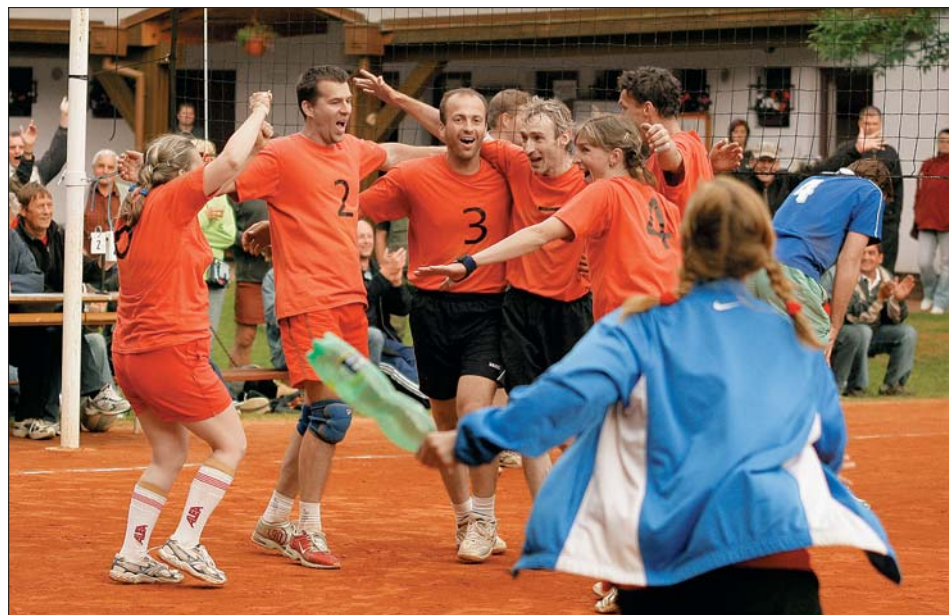
Sněženky a machři - vítězové 1. Městské FIPO-CZECH volejbalové ligy 2009.