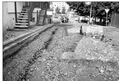
Stav po povodni: odkryté vodovodní a plynové potrubí - pohled z opačné strany.

Takto byla připravena původní zpráva, ale... Změny počasí jsou v posledních letech rychlé. Dříve nebývalé povodně se už stávají jevem častým a obávaným, ale specialitou jsou povodně bleskové. Jedna z nich začala v podvečerních hodinách 16. srpna i ve Svitavách. Z obyčejné spršky se během krátkého okamžiku stala průtrž, doprovázená silným větrem. Nejhůře se podepsala na okolí křižovatky ulic Kapitána Jaroše, Mýtní a ul. Pod Viaduktem.