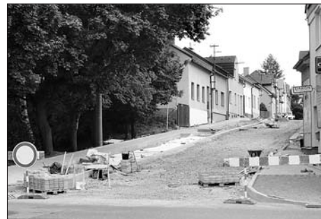
Původní foto rekonstrukce vozovky ulice Pod Viaduktem před bleskovou povodní.

O prázdninách byly zahájeny dvě dopravní stavby. V ulici Pod Viaduktem budou opraveny povrchy komunikace a dláždění chodníků. V Lačnově u základní školy vzniká menší parkoviště pro osobní automobily a u silnice I/43 se buduje chodník a přechod pro chodce. Práce probíhají tak, aby stavbu mohli využít školáci na své první cestě do školy. Miroslav Doseděl