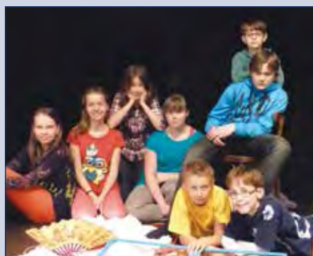
Brambůrky - Tajemný Skellig