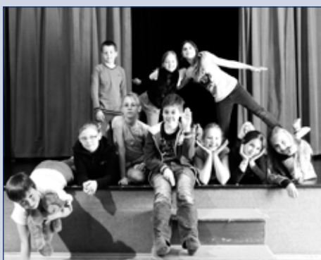
Čečetky - V každém lese je myš, která hraje na housle