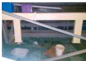
Do konstrukce střechy na mnoha místech zatéká.

- V programovacím období EU 2014–20 se zateplování podobných budov mělo stát součástí dotačních programů, a tak v květnu roku 2015 byla zadána práce na studii, která měla vyřešit energetickou náročnost budovy bazénu, současně obrátit trend klesající návštěvnosti a celý objekt zatraktivnit. Studie, která v sobě měla i architektonický posudek objektu, ukázala, že zateplení střechy bazénu není ze statického hlediska možné a je nutné zhotovit střechu novou. Problematické se však ukázaly boční stěny, které jsou tvořeny soustavou dřevěných oken ve velmi špatném technickém stavu, což odpovídá použitím tehdy známé technologie. Jediné řešení – téměř celý obvodový plášť bazénu zbourat. Na základě tohoto zjištění se vedení města rozhodlo pro zcela zásadní modernizaci, přestavbu a rozšíření krytého bazénu.