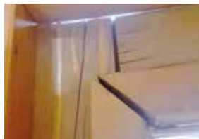
Okna objektu již netěsní. Dochází tím k velkým energetickým ztrátám.