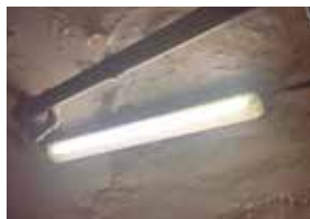
Strop ve strojovně - dochází zde k zatékání z bazénové haly.

- V průběhu roku 2015 byly záměry a dílčí studie diskutovány s plaveckou veřejností, s oddíly, mateřským centrem a s handicapovanými. Snahou bylo vyjít vstříc potřebám všech, tedy široké veřejnosti všech věkových skupin i zájmů. V prosinci 2015 byla studie představena svitavské veřejnosti na tématickém kulatém stole. Všechny připomínky jsme vyhodnotili a provedli úpravu studie dle připomínek a požadavků. Aktualizovaná studie odhadovala náklady cca 145 mil. Kč.