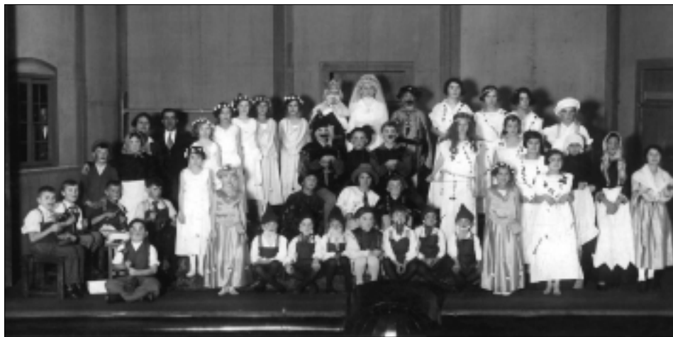
Divadelní soubor při České měšťanské škole ve Svitavách v roce 1935.