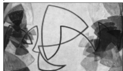
F. Kupka: Sóló hnědé čáry