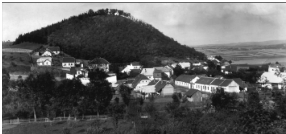
Pohled na osadu Svitávka na místo, kde stávalo staré slovanské hradisko. Ze sbírky pohlednic M. Samkové.