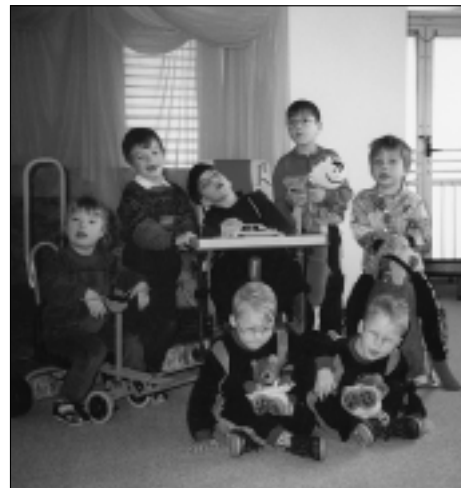
Děti ve Speciální Mateřské škole Svitavy.

školských zařízeních, v ústavech sociální péče i v péči domácí. To, co se zdravým dětem jeví jako zcela normální, pro postižené je svátkem. Dokáží se velmi radovat a být vděčné za každou maličkost. Tato radost postižených je odměnou pro ty, kteří nezištně pro retardované pracují.