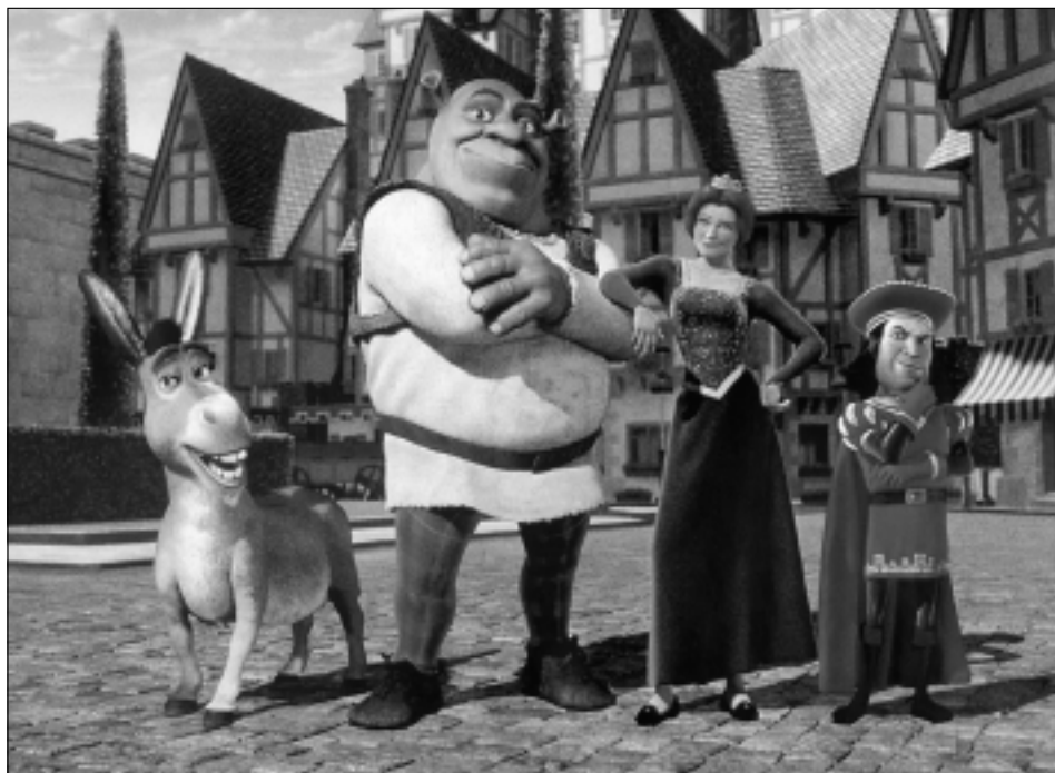
Postavičky z filmu Shrek.

Hrdinou počítačově animované rodinné ko- medie, natočené podle knížky Williama Stei- ga, je zlobr (zvláštní druh obra). Je ošklivý, žije v ústraní lidí, každý se ho bojí. Vyznaču- je se však veskrze dobromyslnou povahou. Vznikl skvělý snímek plný odkazů na nejruž- nější pohádky a filmy. Vyznačuje se doko- nalým technickým provedením i výtvarnou stylizací, kombinující fantastické prvky s hyperrealistickou kresbou.