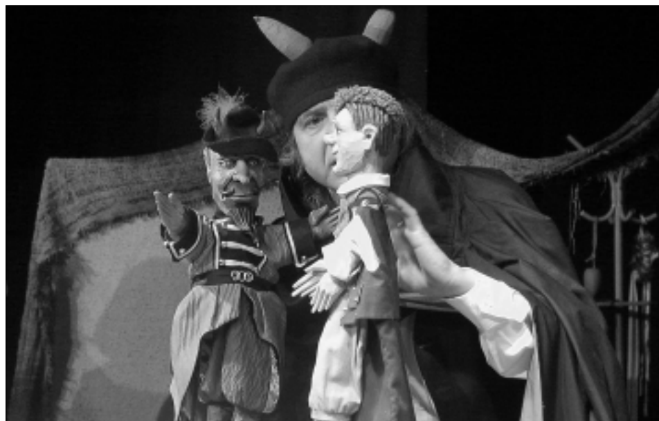
Malé divadélko Praha: O statečné princezně Máně