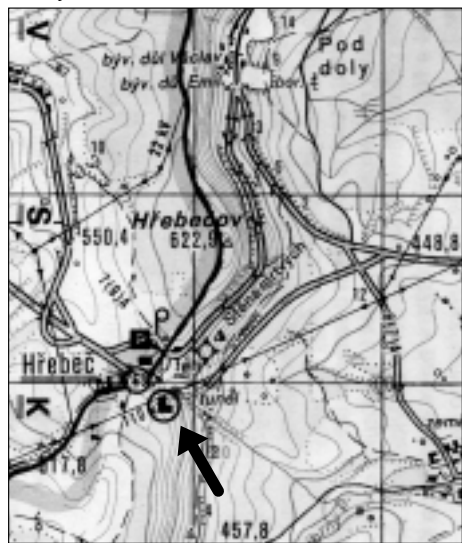
Výsek z turistické mapy Svitavsko s polohou hrádku na Hřebči

Chtěl jsem napsat něco o dávných hradech a tvrzcích. Vzal jsem si do rukou s muzejní badatelské knihovny knihy A. Sedláčka: Hrady, zámky a tvrze království českého I. díl , a pak mne napadlo, zda jsem se nezbláznil. Vždyť Svitavy ležely na Moravě a žádnou publikaci o moravských hradech nemám. Při pohledu na mapu mne zamrazilo, o čem vlastně psát, vždyť kolem Svitav nic nestojí a ani nic v rozvalinách neleží. Napadlo mne: Svojanov už byl tolikrát popsán, zámek Litomyšl je skutečným architektonickým skvostem, zámek v Moravské Třebové už dostává svoji novou tvář. Snad Cimburk u Městečka Trnávky není tak všeobecně známou stavbou. Tak jsem začal hledat i v ostatních publikacích badatelské knihovny, nikde nic. Jako by se nejbližšímu svitavskému okolí ta romantická