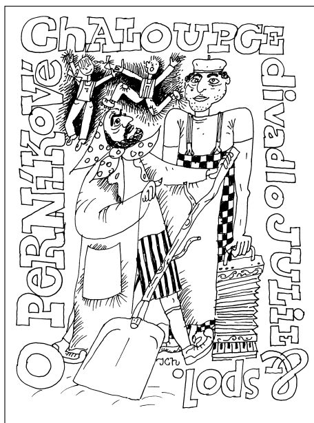
Pohlednice divadla Julie & spol. Kresba Jaroslav Chmelík

27. Ne 15:00 hod. Divadlo Trám Divadlo C Svitavy: Bystrouška, liška Vstupné: 30,- Kč