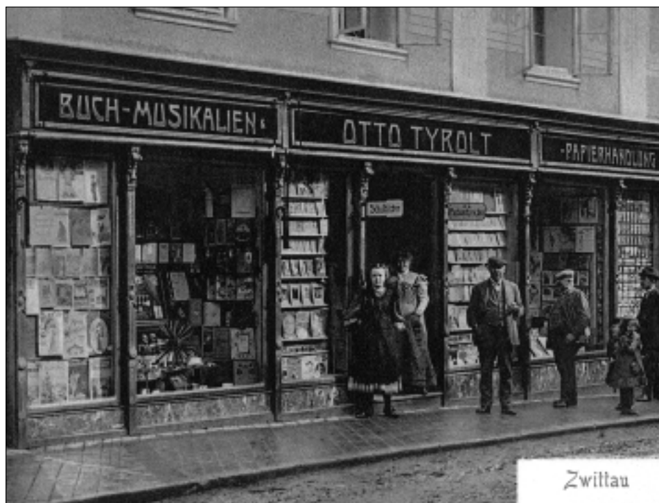
Obchodní dům Tyrolt s majitelem a zaměstnanci. Ulice: Neustadt 2, neznámý autor, kolem roku 1900.