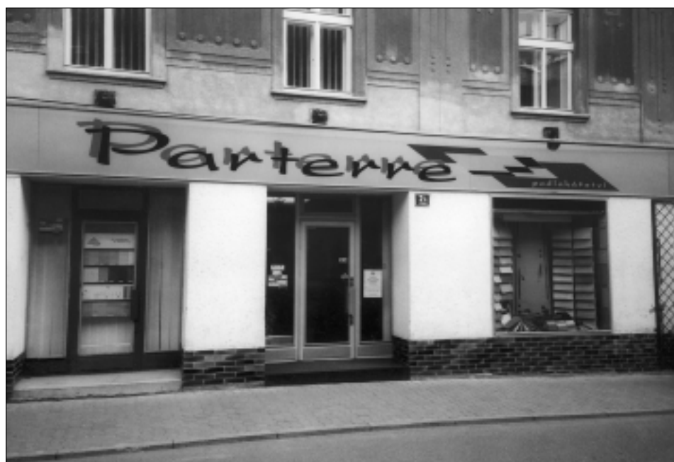
Současný pohled na prodejnu podlahových krytin Parterre. Ulice: T. G. Masaryka 2A, listopad 2001.