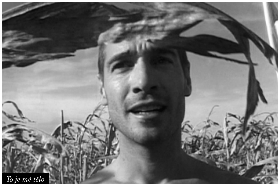
To je mé tělo

Všechna představení proběhnou v kině Vesmír a začínají vždy v 19:30 hodin.