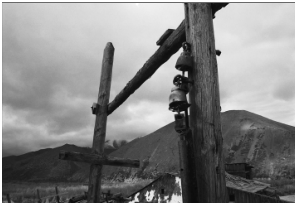
Opuštěný pracovní tábor, kde se těžil kobalt.

Součástí vernisáže bude beseda se členy štábu České televize Praha a projekce ukázek z připravovaného dokumentu.