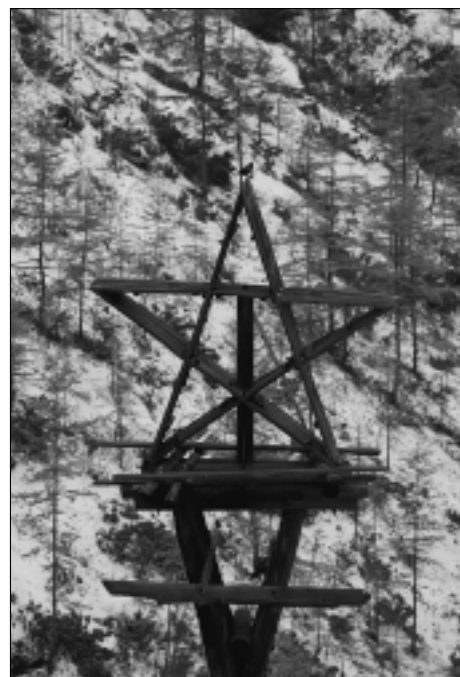
Tato hvězda svítila při komunistických výročích.

Strávili jsme tam téměř tři týdny. Chodili jsme po místech, která jsou němými svědky nejtemnější části ruské minulosti. I když jsou dřevěné vězeňské baráky již téměř rozpadlé, zarostlé vysokou trávou a divokým křovím, nelze je z ruské historie vymazat. Pryčny, latríny, boty, kabáty, lžíce, plechovky, rukavice připomínají, že zde byli lidé. Na svazích hor ční kůly a mezi nimi se zlověstně vine až nahoru ke strážní věži ostnatý drát. Nádherná panenská příroda ruské tajgy nás sice očarovala, ale zároveň jsme pocítili na vlastní kůži její sílu a nevyzpytatelnost. Odříznuti od světa jsme