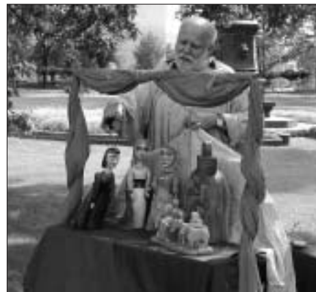
Bílkovalo kratochvílné divadlo Staré pohádky české 21. července v Parku Jana Palacha, konaného v rámci SLS 2002.

7. září Sobota 9:00 hod. Stadion Míru 6. fotbalový turnaj přípravek o putovní pohár starosty města Svitavy