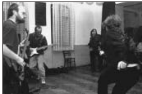
Nejhodnější medvídci Hradec Králové

28. So 19:30 hod. Bílý dům Benefiční koncert pro Kojenecký ústav ve Svitavách