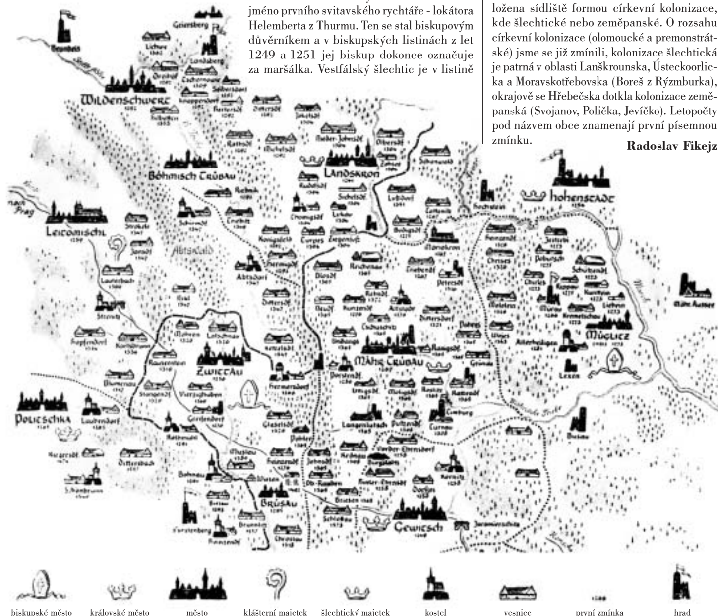
Hřebečsko po osídlení ve 13. století.