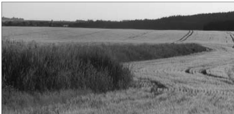
Hráz rybníka u zahrádkářské kolonie na ulici Majakovského.