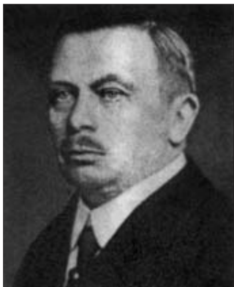
Dr. Franz Spina

Není to tak dávno, co jsem v rozhlasu slyšela navržená jména na vyznamenání. V seznamu kandidátů bylo i jméno dr. Franze Spiny. A vysoké - Řád T. G. Masaryka mu má být udělen in memoriam po 65 letech od jeho neblahé smrti. Seznam sestavila parlamentní komise.