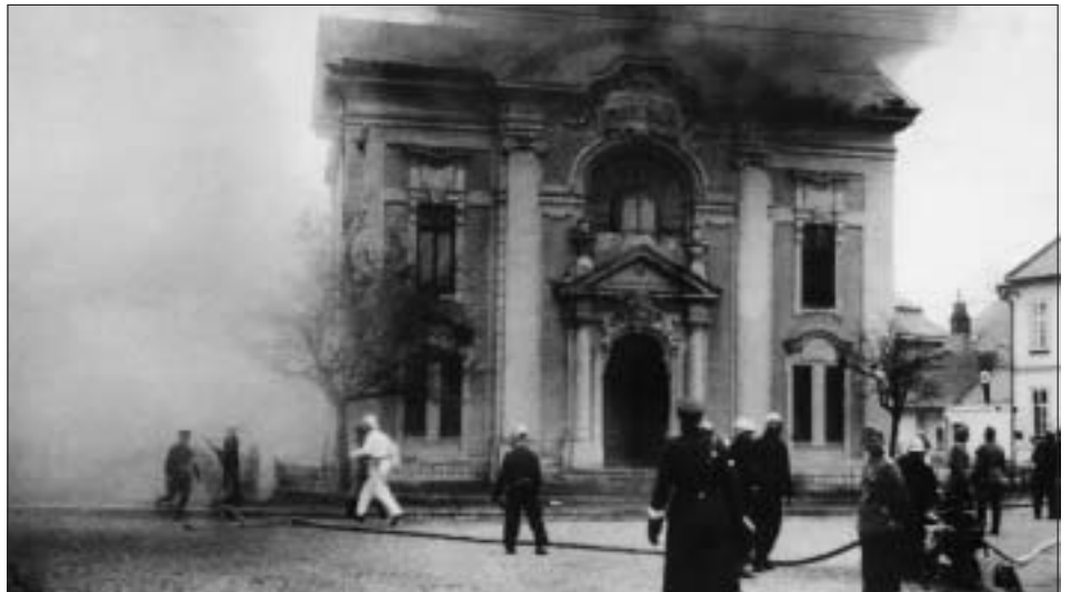
Křišťálová noc ve Svitavách v roce 1938.