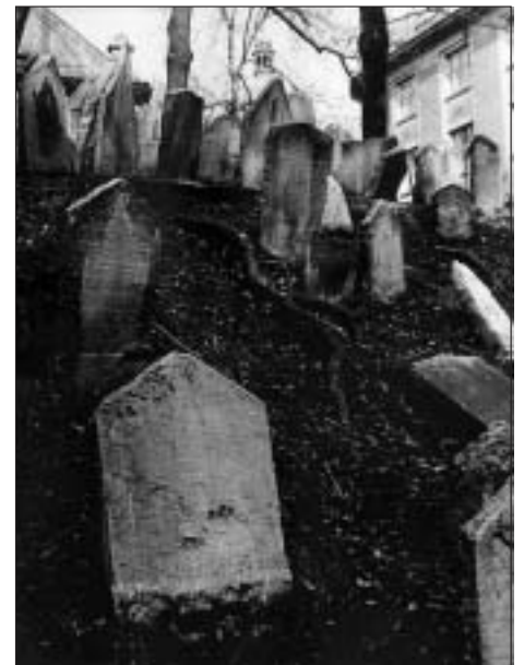
Jaroslav Kupčák: Židovské hřbitovy

Výstava osmdesáti fotografií sedmi autorů ve Svitavách je rozdělena do dvou částí. První je instalována v prostorách Městského muzea a galerie a tvoří ji fotografie pozůstatků opuštěných židovských hřbitovů. Míst, která mají úžasnou atmosféru a kde již dnes, po hrůzách 2. světové války, není koho pohřbívat. Druhou část výstavy naleznete ve vestibulu Bílého domu a zachycuje momentky z návštěvy současníků v prostorách bývalého koncentračního tábora Osvětim. Fotografie z míst, která budou již