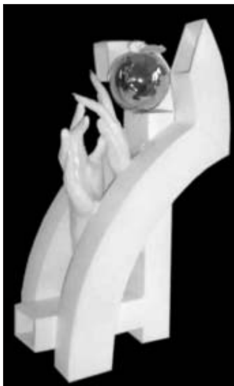
Adam a Eva