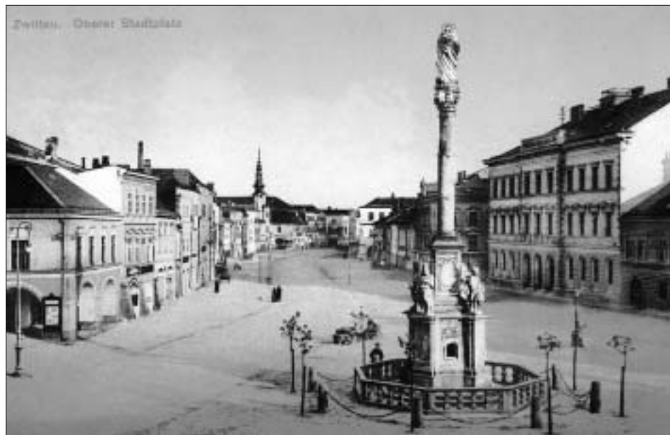
Pohled na svitavské náměstí z roku 1901.