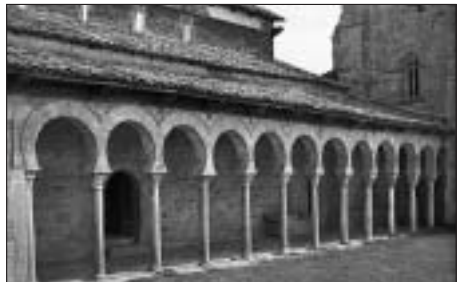
San Miguel de Escalada u Leónu. Málokterá země v Evropě má tak početnou skupinu zchovalých předrománských kostelů jako mozarabské Španělsko.

Pokračování cyklu přednášek, věnovaných dějinám umění. Doc. PhDr. Petr Kmošek, CSc, teoretik, historik umění, publicista a malíř bude opět poutavě vyprávět krom jiného o umění barbarských národů, stavění kaplí a kostelů, o předrománských stavbách ve Španělsku, o irských klášterech a jejich vybavení a vikingském umění.