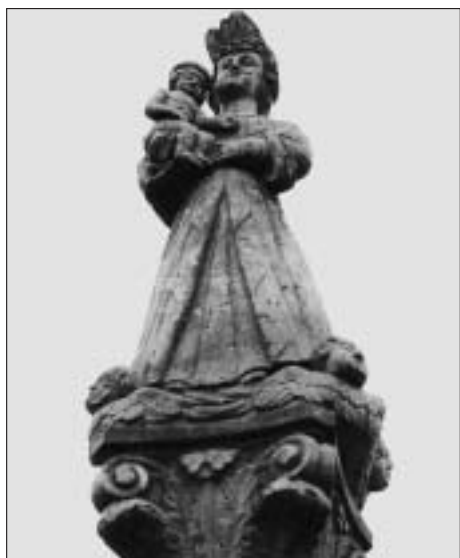
Panna Maria Vambeřická na Hraniční ulici

Minulý měsíc jsme skončili vyprávěním o mariánském sloupu na svitavském náměstí. Připomněli jsme si rok vzniku, jeho opravu a popsali jsme si světce, kteří obklopují dřív sloupu. Baroko zanechalo v našem kraji výrazný otisk v podobě mnoha soch, světeckých sloupů a křížů. Některé z nich již nadobro zmizely z míst poblíže cest, mostů či přímo z náměstí. Zůstaly pouze podstavce, torza železných konstrukcí či snad pouhá zmínka v pramenech a literatuře. Tak kolorovaný plán města Svitav z roku 1848 z pera Adalberta Georga Stochlawetze vypovídá snad o jednom z nejstarších křížů. Ten měl stát kdesi v prostoru ulice Hraniční, před řadou domů č. 19 - 23, před domem tkalce Johanna Haase. Kříž nesl na podstavci rok 1688, ale těžko říci, kde skončil. Mimochodem na Hraniční ulici je ještě jeden barokní sloup. Panna Maria Vambeřická stojí stranou před lékárnou a jemnozrnný pískovec, ze kterého je dlátem neznámého autora vysochána, je datován do období kolem roku 1800. Prosebný německý nápis je sice částečně nečitelný, ale na podstavci jsou k rozeznání reliéfy sv. Antonína Paduánského, sv. Jana Evangelisty a sv. Anny. Na dřívku sloupu vystupuje mariánský monogram. Taková socha se ničím nevymyká z běžné regionální tvorby, mimochodem shodný typ stojí také v Opatově u Svitav.