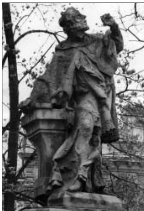
Svatý Jan Nepomucký na Brněnské ulici

Na Brněnské ulici, při státní silnici, sleduje provoz jedna z mála signovaných soch. Tam kdysi stál most přes řeku a u něj světec. Nevím, jak je to možné, ale v literatuře byla socha připsána Janu Sarkanderovi. Ten omyl se tradoval dál a dál, ale oprava, která proběhla v loňském roce,