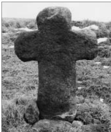
Smírčí kříž v Mor. Lačnově

vrcholném středověku, většinou od 14. století, a s jistou setrvačností pak až do počátku 18. století. Vlastní smírčí kříže stavěl viník v rámci trestu na místě vraždy nebo zabití na znamení usmíření s Bohem, s duší zemřelého i s pozůstalými oběti, které musely být současně odškodněny nějakou finanční částkou. Šlo tedy vlastně o mimo soudní vyrovnání.