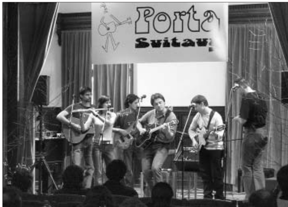
Vítězná kapela Marien z Pardubic.