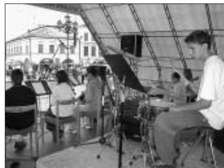
Dětský swingový orchestr na Pouti ke sv. Jiljí v roce 2004

Orchestr má 15 členů, kteří hrají na různé hudební nástroje - saxofony, klarinet, příčné flétny, trubky, klavír, kytaru, baskytaru, bicí a zpěv. Repertoár orchestru tvoří hlavně swing, populární hudba, ale také např. hudba z filmů. Věk členů orchestru se pohybuje v rozmezí od 13 do 18 let. Všechny děti navštěvují ZUŠ a rozvíjejí si tak dovednosti získané při výuce a uplatňují je v praxi. Vstupné: dobrovolné