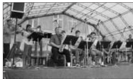
Bigband Svitavy na Pouti ke sv. Jiljí v roce 2004