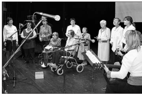
Ladí - neladí, ÚSP Svitavy

Radostí, která přímo čišela z malých zpěváků sboru Svitaváček, kteří se za ruce ve vzácné shodě, kterou už mezi sebou v životě budou těžko hledat, vedli na jevišti. Radostí zpívajících dívek sboru Hlásek, že je hudba baví. Radostí postižených z Ústavu soc. péče z toho, že když v životě jejich hlavy a těla neposlouchají jak by měly, přeci jen dovedou vzájemně secvičit hudební vystoupení a trefit se do taktu. Obrovskou radostí a zápalom pro věc klientů Světlanky, kteří dokázali, že hrají scénku o ztroskotání letadla na pustém ostrově ohrožení hladovým krokodýlem a unikající zpět k civilizaci pádlující na lodi nejen pro samotnou benefici, ale i z radosti nad překonáním sebe sama, z radosti nad tím, že společná věc a prožitý čas je opravdu baví, z radosti nad tím, že mohou někoho rozesmát, což se jim opravdu podařilo. Přiznám se, že bych se i přidal. Každopádně názvu Světlanka