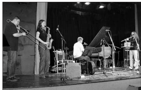
Z Větrného večera 9. 4. 2004

4. 17:00 hod. Ottendorferův dům Benefiční koncert ve prospěch opravy kostela sv. Josefa