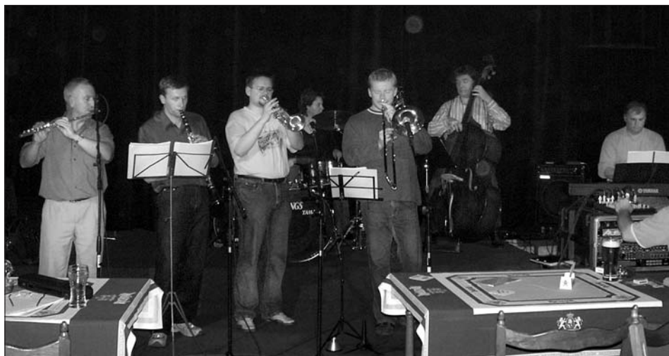
Z Jamm Sessionu 7. 10. 2005