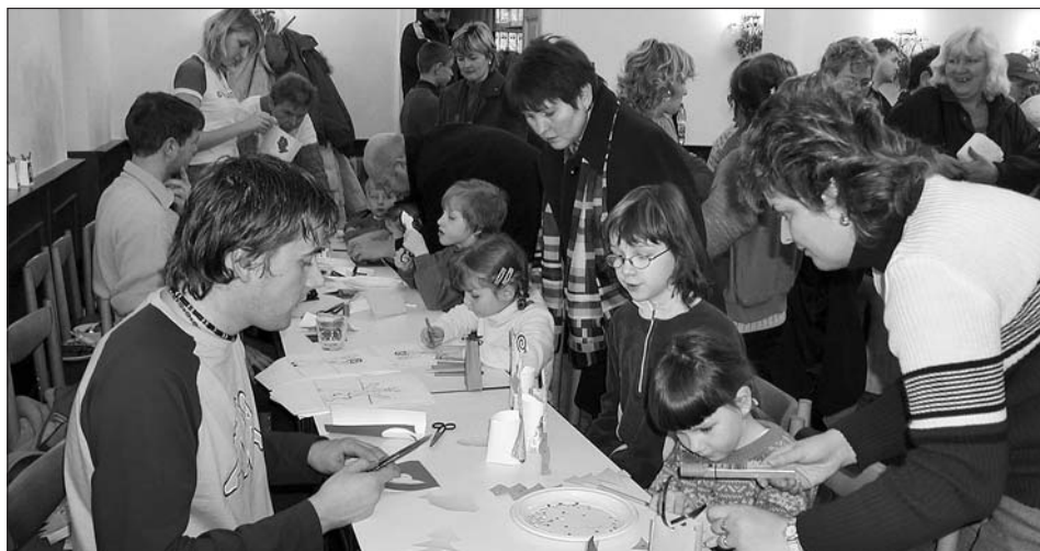
Vánoce ve Svitavách 2004 - výroba drobných vánočních dárků