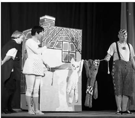
Z vystoupení Divadla Duha z Polné na Burze ve Svitavách v roce 2002

Doporučeno pro MŠ a 1. stupeň ZŠ Vstupné: 25,- Kč Sleva pro dojíždějící školy: 20,- Kč