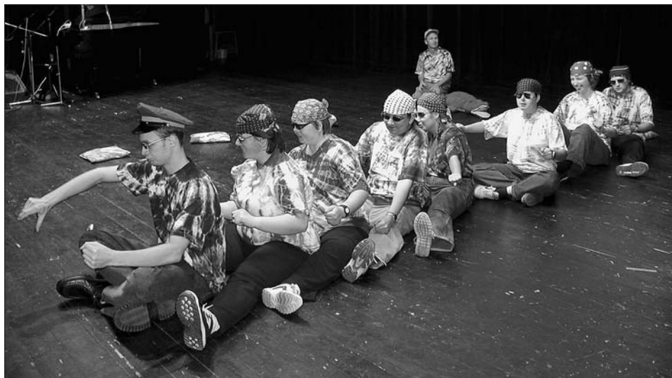
Vystoupení klientů Světlanky