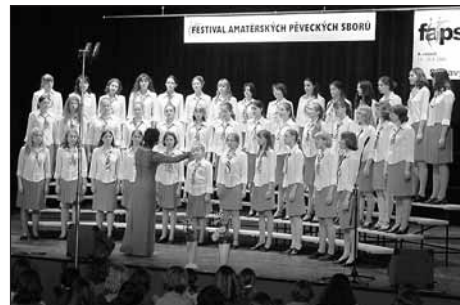
Dětský pěvecký sbor Alye Parusa Rybinsk z Ruska na FAPSu v roce 2004