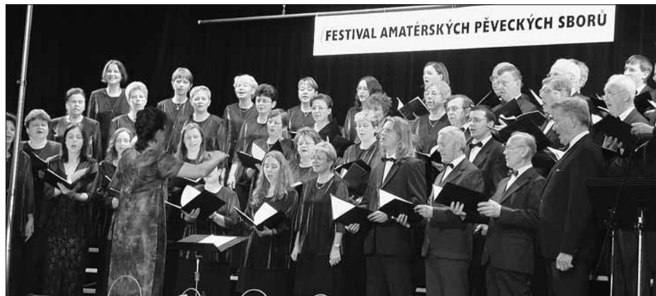
PS Smetana z Hradce Králové na FAPSu v roce 2004.