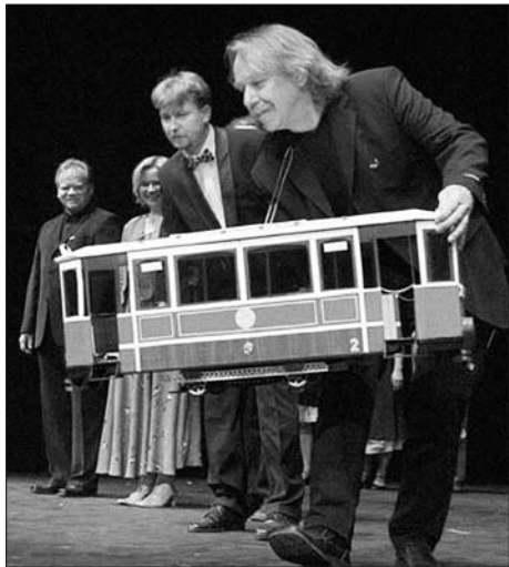
Těšínské divadlo Český Těšín - Těšínské niebo - Cieszynskie nebe