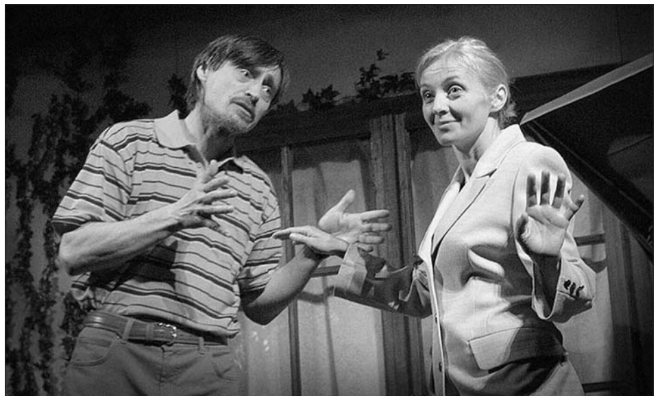
PROSPER Praha - Kachna na pomerančích

Předprodej abonentek bude zahájen 18. září 2006 v Informačním centru (otevřeno pondělí - pátek 8:00 - 17:00 hodin, sobota 9:00 - 12:00 hodin). Stávající abonenti mají možnost výměny své abonentky od 11. září 2006 také v Informačním centru.