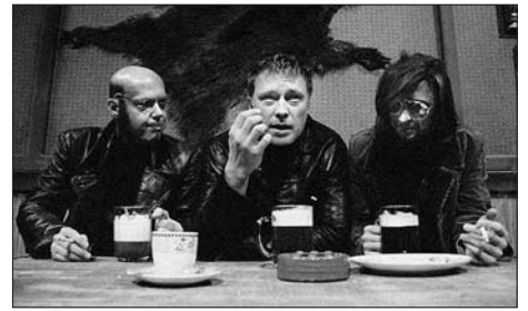
Švandovo divadlo na Smíchově Praha - Žebrácká opera

Inteligentní komedie o době, kdy pravda a láska přestala vítězit nad lží a nenávisť