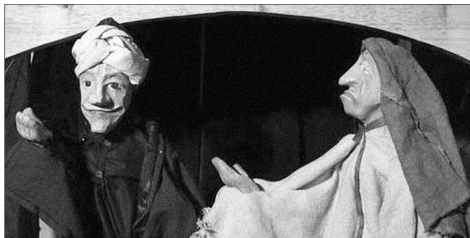
Na svitavské Pouti ke sv. Jiljí vystoupí i Divadlo Mimotaurus

Úterý - Pátek 9 - 12 13 - 17 Sobota 9 - 13 Neděle 13 - 17