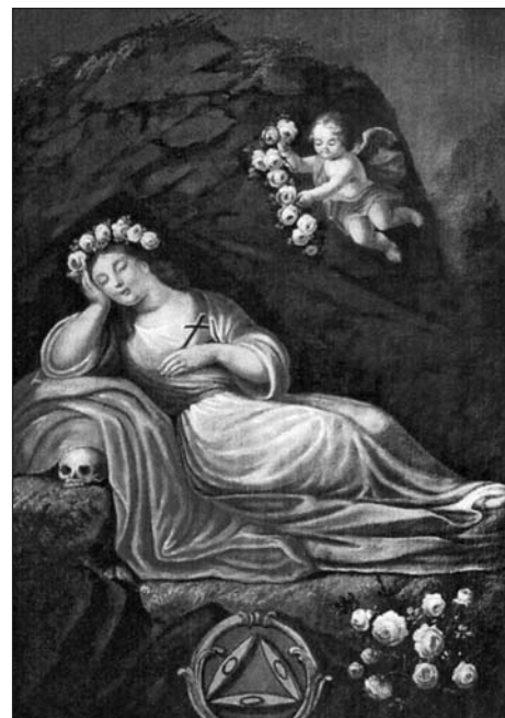
Zrestaurovaný soubor procesních korouhví tkalcovského cechu: Pieta, sv. Jiljí a sv. Rosalia.