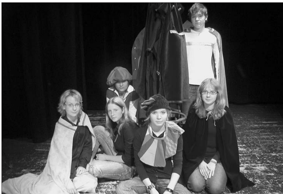
Soubor Bruncvíkové DŠ: Urhamlet.

29. Po 19:30 hod. Bílý dům The Best of Tour 2007