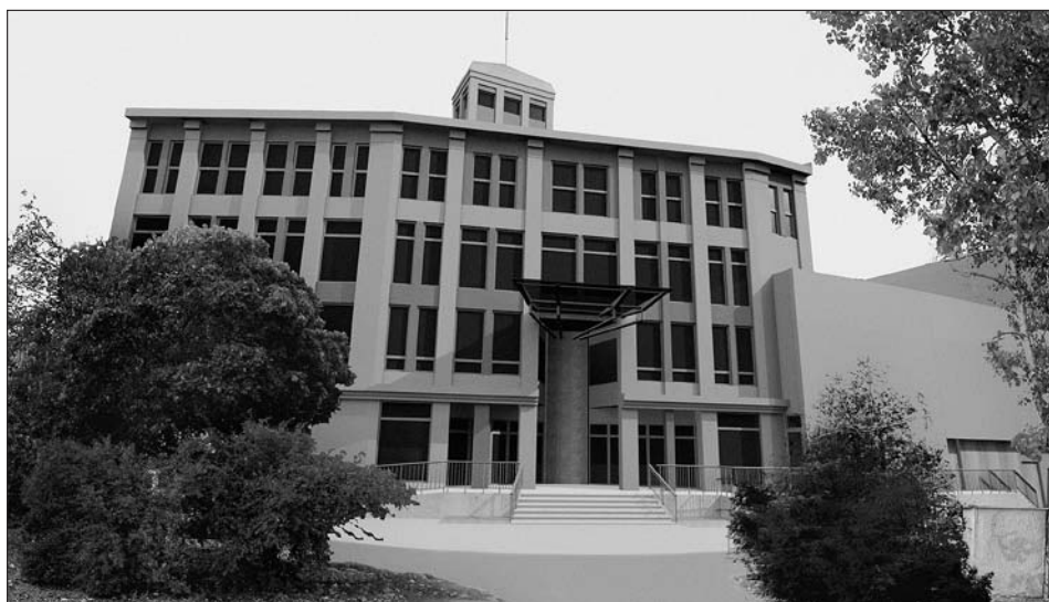
Studie objektu Fabrika.

Uprostřed města pod náměstím Míru na Wolkerově aleji stojí stará textilní továrna. Byla postavena v roce 1926 a zhasla v roce 1996. Od té doby jen tiše ční nad řekou Svitavou... přežila i sousední školu... Vlastně dnes už nemluví...před třemi lety se zastupitelé města rozhodli továrnu koupit, vypracovat projekt, předložit Evropské unii a pustit se do díla: z textilky multifunkční vzdělávací, komunitní a kulturní centrum Fabrika. Projekt uspěl!