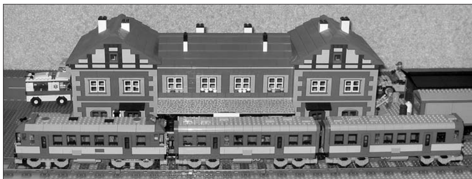
Část nádraží složeného ze stavebnice Lego.