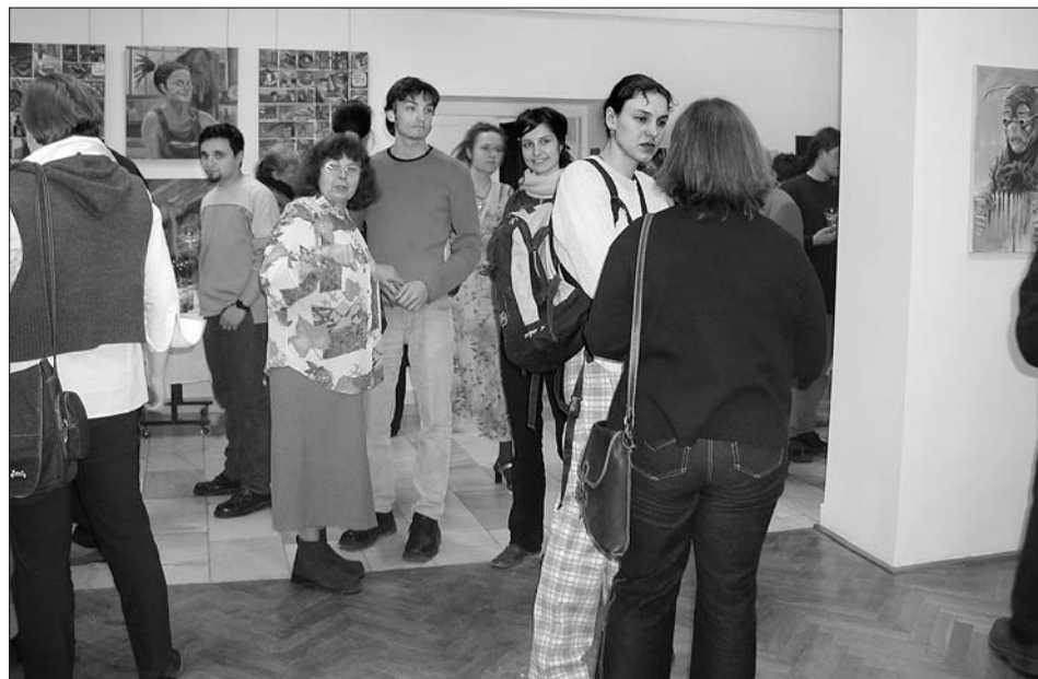
Vernisáž výstavy studentů AVU ve Svitavách v roce 2003.