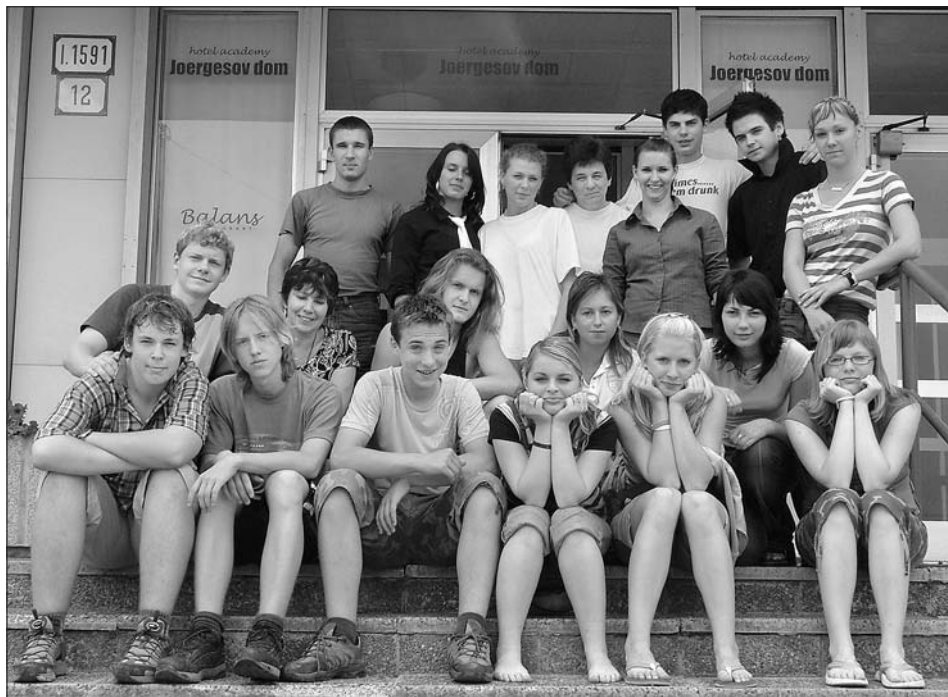
Docela Malé divadlo v Banské Štiavnici.