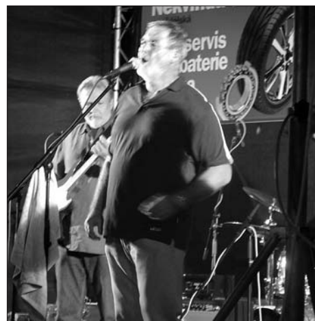
Michal Prokop - koncert na náměstí 5. září