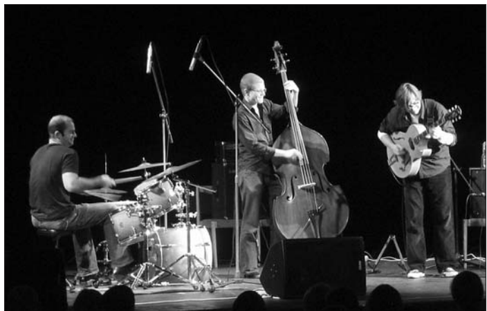
Rudy Linka - úžasný koncert světového jazzového kytaristy s americkými muzikanty ve Fabrice 12. listopadu