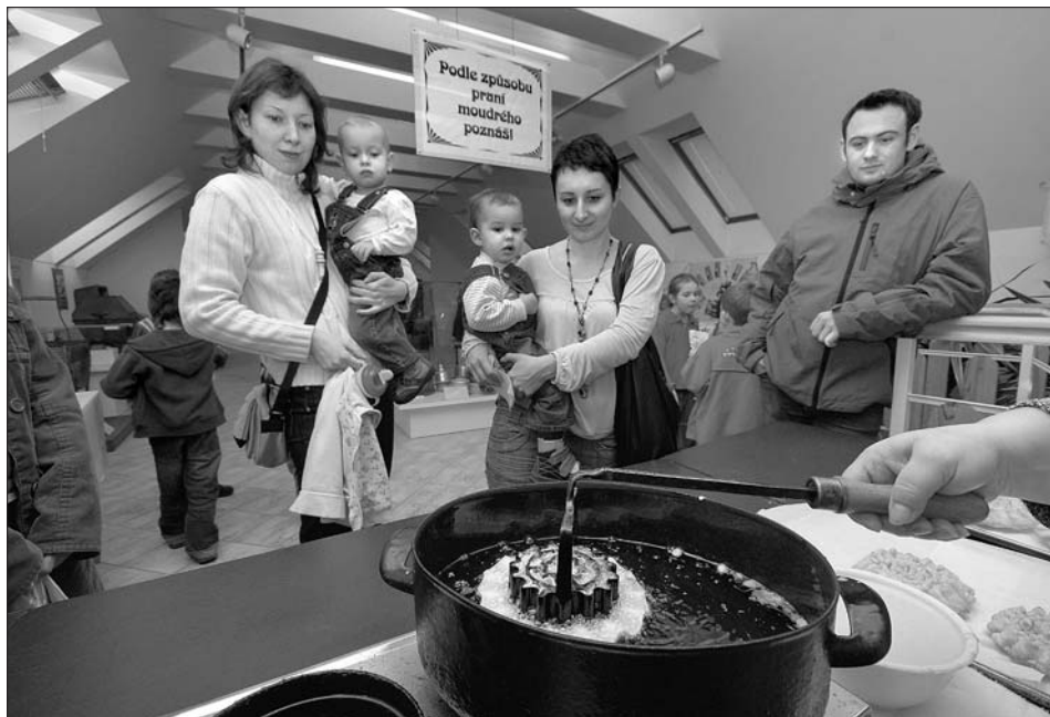
Oblíbené smažení vánočních hřízd z odpalovaného těsta ve svitavském muzeu.

Už devatenáct let - od roku 1990 - pro vás každý rok připravujeme v předvánočním a vánočním období řadu kulturních setkání. I letos tomu nebude jinak. Začneme tou největší vánoční akcí, která ve Svitavách probíhá vždy druhou adventní nedělí.