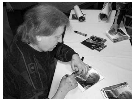
Václav Neckář - poslední koncert v Bílém domě 24. dubna