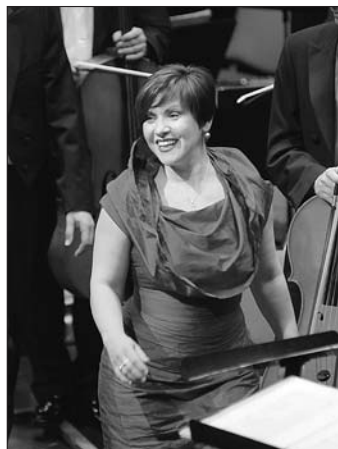
Dagmar Pecková - koncert Smetanovy Litomyšle ve Fabrice 19. června