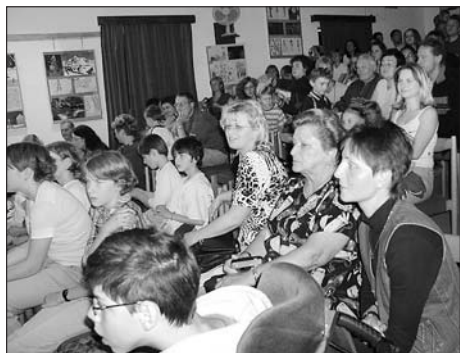
Školičkové tramtadyjá z roku 2004.