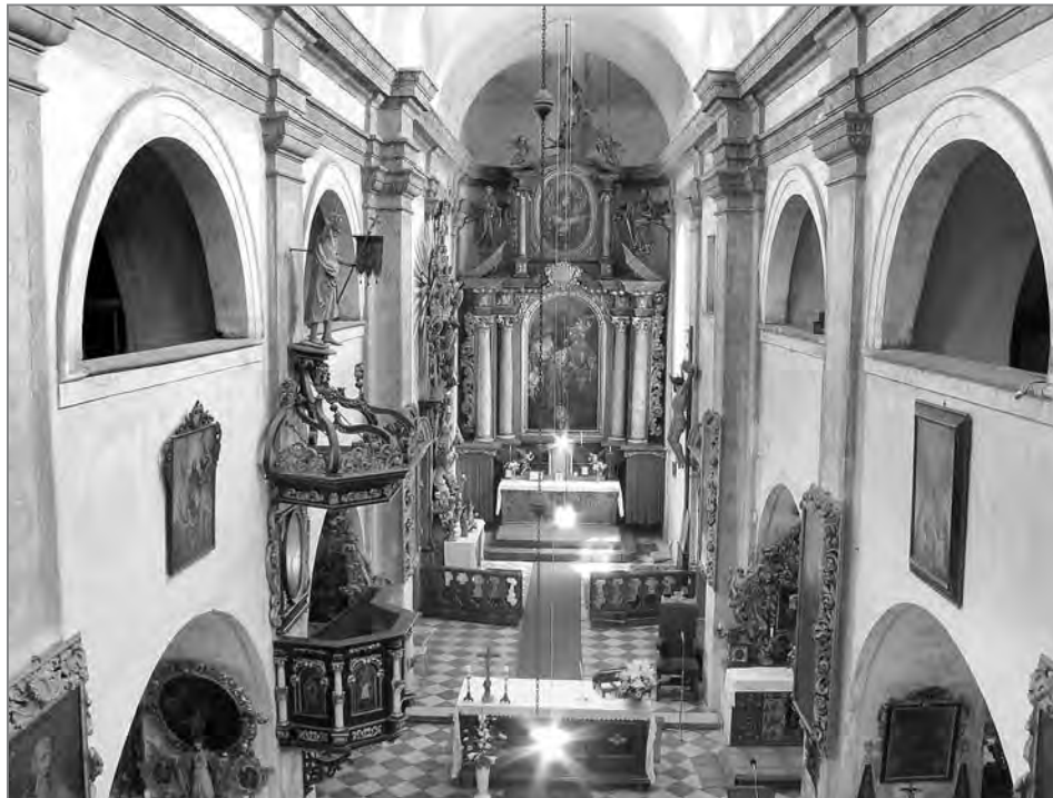
Interiér kostela sv. Jiljí.

jednoznačně, v Horkého kronice se tento zápis pojí s rokem 1686 a osvobozené město mělo být Budín, ale jisté je, že místo kázání mělo být v kostele sv. Jiljí či poblíže něj. A tak se po měsíci vrátíme do našeho známého místa.