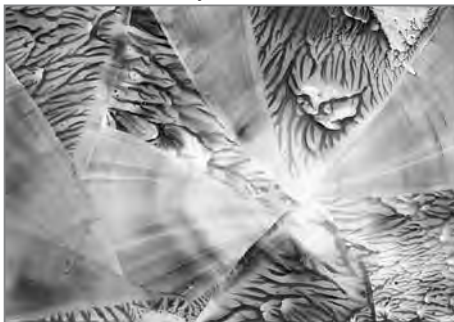
Autoři: Marie Vorlová a Zdeněk Bureš

Charita Svitavy Vás zve na společnou výstavu obrazů uživatelů, lidí s mentálním postižením a seniorů s názvem „Proměny“. Ver-nisáž se uskuteční ve čtvrtek 1. března ve 13:00 hodin ve foyer Fabriky Svitavy. Součástí programu bude také kulturní vystoupení uživatelů Světlanek. Výstava potrvá do pátku 13. dubna. Všichni jsou srdečně zváni.