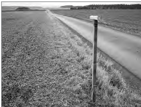
„Berlička“ pro dravce