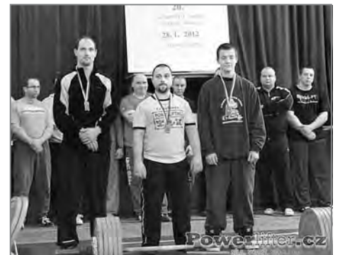
Kategorie do 74 kg

Jednotliví závodníci se tak představili v kategoriích žen do 57 kg, muži startovali v hmotnostních kategoriích do 59 kg, do 66 kg, do 74 kg, do 83 kg, do 93 kg, do 105 kg a do 120 kg.