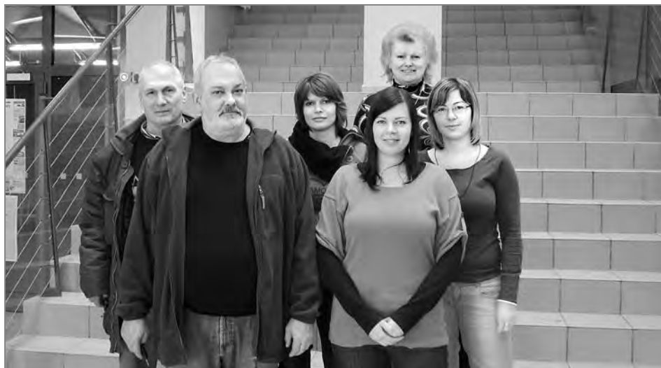
Pracovníci Střediska sociálních služeb Salvia Svitavy