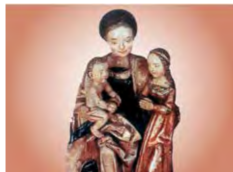
Půvabná plastika sv. Anny Samotřetí