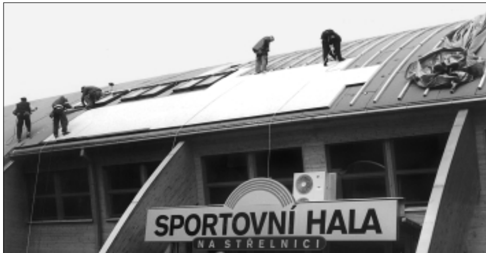
Jak jsme psali v minulém čísle, sportovní hala Na Střelnici dostala další lehký střešní plášť, který eliminuje možné nebezpečí vzniku kondenzátu a s tím spojených problémů.