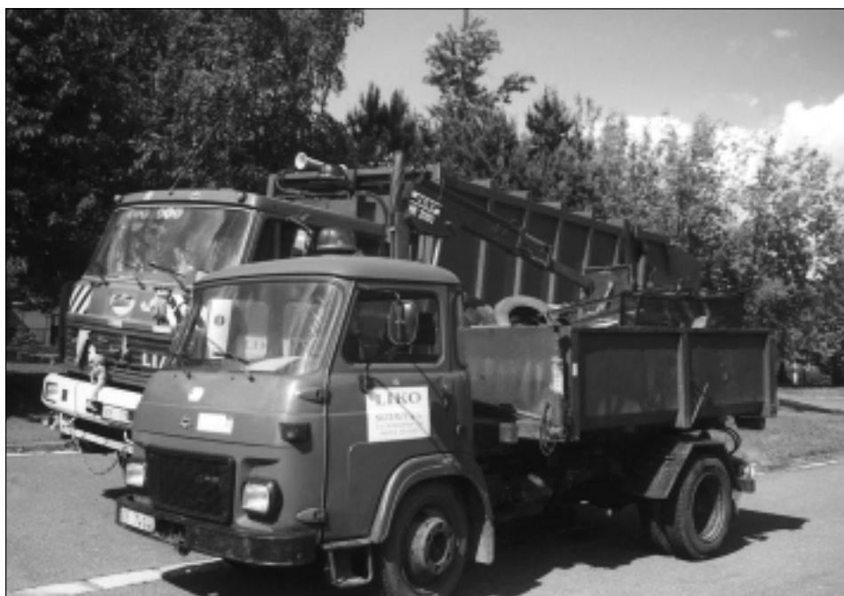
Vozidla a. s. LIKO jsou již připravena.

Velkoobjemový odpad: Za velkoobjemový odpad je považován odpad komunální povahy, který nelze uložit do běžné svozové nádoby. Jedná se tedy o vyřazené kusy nábytku, koberce, lina, staré matrace, dětské kočárky apod... V rámci svozu budou odebírány též pneumatiky, staré oděvy, noviny a časopisy.