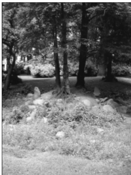
„Rybníček“ v parku J. Palacha v létě 1999.