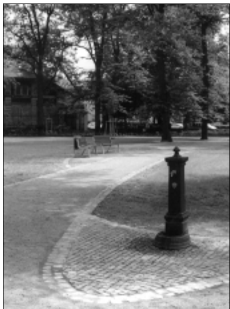
Pítka v parku Jana Palacha.

Novým způsobem, jak osídit orgány města a přijít bez problémů k obecnímu bytu, jsou fingované výměny bytů mezi nájemci. Již druhým takovým případem se zabývala rada města v říjnu a výsledkem bylo zrušení dříve vydaného souhlasu s výměnou bytů a uzavřením nájemní smlouvy. I v tomto případě šlo o to, že původní nájemci obecního bytu zatajili, že mají jiný vlastní byt, do něhož se dokonce již přestěhovali, a namísto aby volný obecní byt vrátili městu pro jeho další použití podle pořadníku, předložili městu dohodu o výměně tohoto bytu s jiným nájemcem. Přestože obě strany prohlásily, že nemají jinou možnost bydlení, evidence městského úřadu ukázaly něco jiného. Město teď bude činit kroky k uvolnění bytu, jehož pronájem byl schválen na základě nepravdivých údajů původních nájemců.