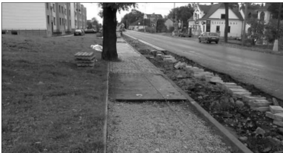
Silnice na ulici Kpt. Jaroše byla uvedena do předčasného užívání ve druhé polovině října a zbývající úpravy budou dokončovány za provozu. Technické služby města současně dokončují úpravy chodníků.