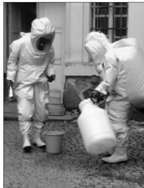
Příslušníci HZS v ochranných oblecích provádějí dekontaminaci plastového obalu, ve kterém je zajištěna obálka s podezřelým obsahem.