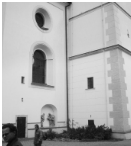
Fasáda kostela Navštívení panny Marie na náměstí vyžaduje opravu. Město se na ni pokusí získat finanční prostředky z dotace od ministerstva kultury.

Půl milionu korun na opravu operačních sálů oddělení ORL svitavské nemocnice pravděpodobně poskytne město Svitavy. Na doporučení rady města o tom bude jednat prosincové zastupitelstvo a protože potřebné prostředky město v rozpočtu má (z navýšení daňových výnosů), může být tato pomoc schválena.