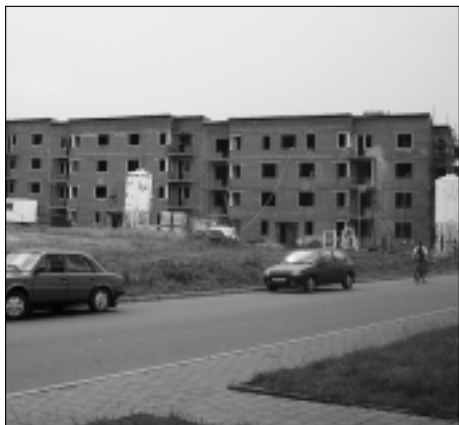
Bytová výstavba Na Vějíři bude pokračovat i v příštím roce.