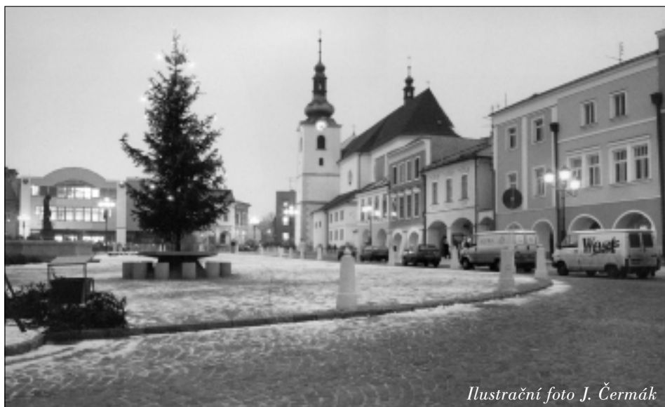
Ilustrační foto J. Čermák

Na Silvestra bude na náměstí opět ohňostroji! Sledujte plakáty