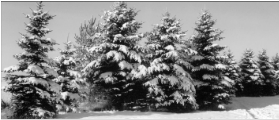
Zimní ráno v lesoparku při Raisově ulici.