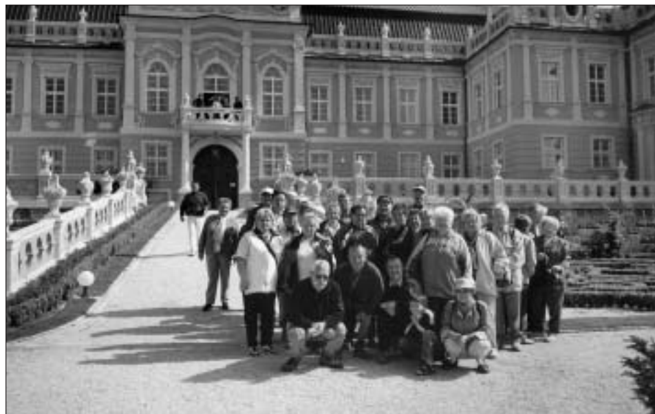
Na květnovém výletě kardiáci navštívili také rokokový zámek Nové Hrady.