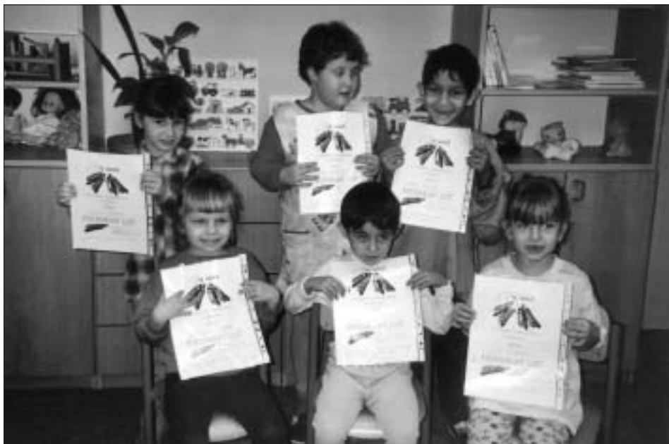
V prvním pololetí všechny děti obdržely Pochvalné listy za dosažené pokroky.