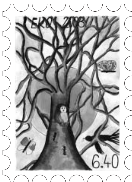
Ludmila Lněničková, ZŠ Felberova, absolutní vítěz soutěže „Ekoznámka 2003“

Také letos vydává odbor životního prostředí MěÚ Svitavy ročenku SVITAVY - ŽIVOTNÍ PROSTŘEDÍ 2002, která představuje komplexní zprávu o stavu životního prostředí ve městě v loňském roce. Ročenka je opět členěna do okruhů podle jednotlivých složek prostředí (ovzduší, voda, městská a příměstská krajina, odpady, zvířata kolem nás) s příslušnými tabulkami a výsledky rozborů. Před rokem jsme z ročenky 2001 vybrali a zveřejnili některé zajímavé informace, letos uvádíme závěrečnou kapitolu, která shrnuje vývoj stavu životního prostředí v minulém roce, poukazuje na přetrvávající problémy a nastiňuje očekávaný vývoj v jednotlivých oblastech. Trošku jsme ji redakčně upravili a někde doplnili další údaje.