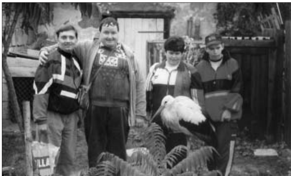
Na návštěvě v „Zeleném Vendolí“ - listopad 2002.