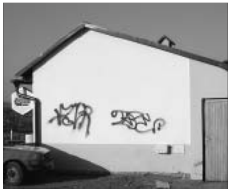
Narovnání způsobených škod může vypadat například takto (jeden z příkladů z roku 2002): Poškozený objekt restaurace v areálu Cihelna před a po opravě.

Jak ukazují příklady ze zahraničí, je to skutečně moderní způsob vypořádání se s touto formou trestné činnosti. V Berlíně již deset let funguje projekt Trialog, jehož