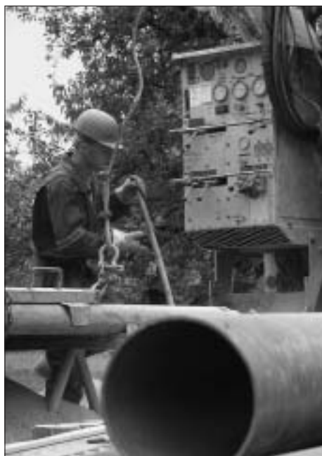
Průzkumné vrty v prameništi Olomoucká byly zahájeny 19. srpna.