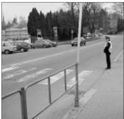
Na začátku školního roku, stejně jako po celý rok, budou dění na přechodech sledovat i strážníci městské policie.

mpor. Stanislav Dobeš, tiskový mluvčí PČR