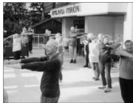
Účastníci rekondičního pobytu při ranní rozcvičce.