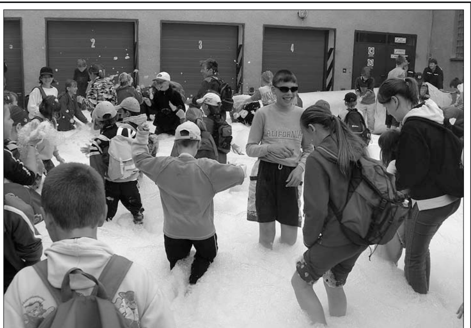
V pátek 18. 6. se v uskutečnil „Den spolupráce složek Integrovaného záchranného systému“. Na této akci se podíleli hasiči, městská i státní policie a záchranka. Jednou z atraktivních praktických ukázek se stal tzv. pěnový útok (viz foto), kdy skutečný hasičí prostředek nahrazoval obyčejný šampón.