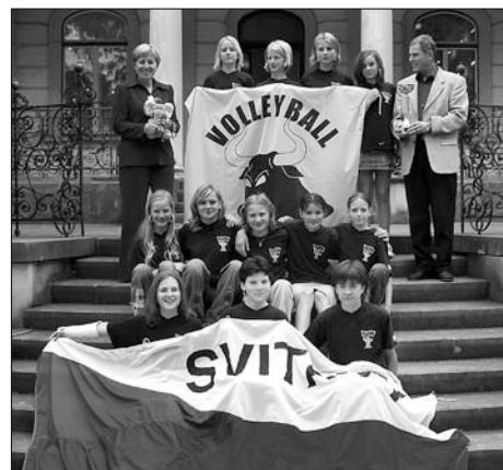
Mladé volejbalistky přijal na radnici starosta Václav Koukal.