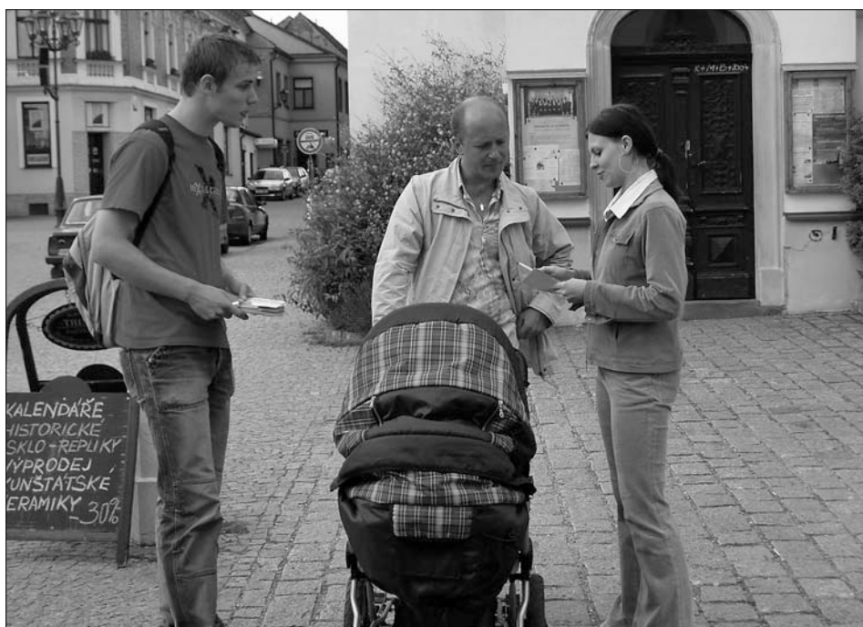
Zjišťovat názory občanů ve městě pomáhali studenti.