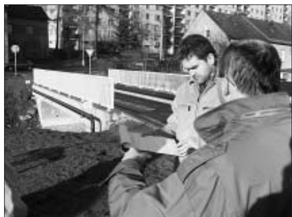
Pracovníci odboru dopravy MěÚ Svitavy při kolaudaci mostů a lávek.

Kolaudace dvou mostů - u bývalého domu služeb na sídlišti Lány a u čerpací stanice Aral - se konala 11. ledna 2005. Mosty byly opraveny v rámci protipovodňových opatření na řece Svitavě a Lačnovském potoce.