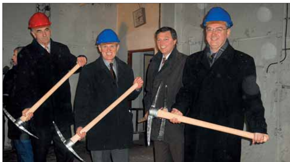
Krátce po začátku „bourání“ ve fabrice.