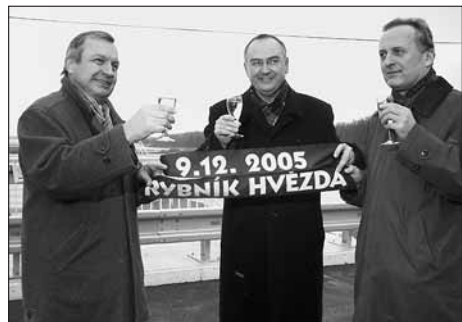
Mezi hosty při slavnostním dokončení „Hvězdy“ byl i vicehejtman Pardubického kraje Roman Líněk (uprostřed).

Na hrázi rybníku Hvězda na rozhraní okresů Svitavy a Ústí nad Orlicí nad obcí Třebovice se 9. prosince uskutečnilo slavnostní předání díla „Třebovka, rybník Hvězda - zvýšení ochranné funkce nádrže“.