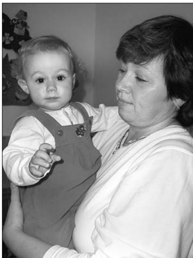
Ilustrační foto Z. Celá