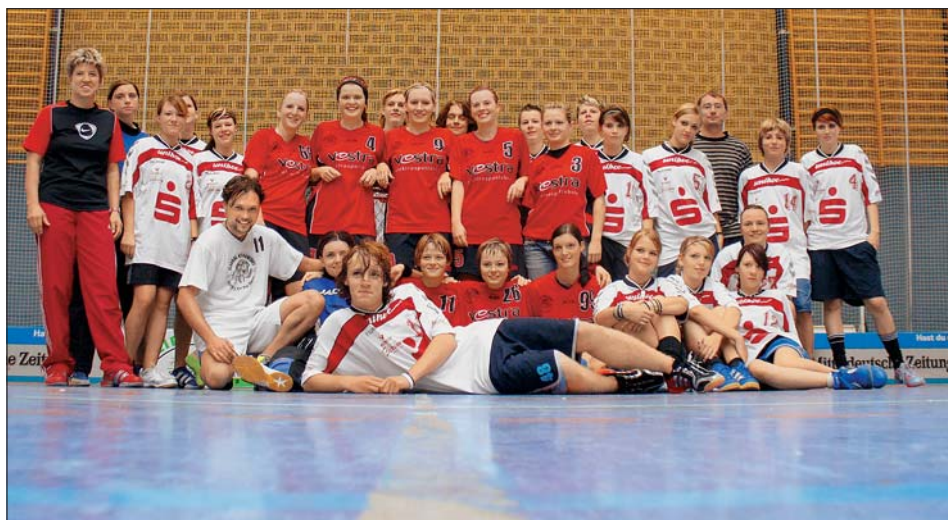
Slavný tým svitavských florbalistek.