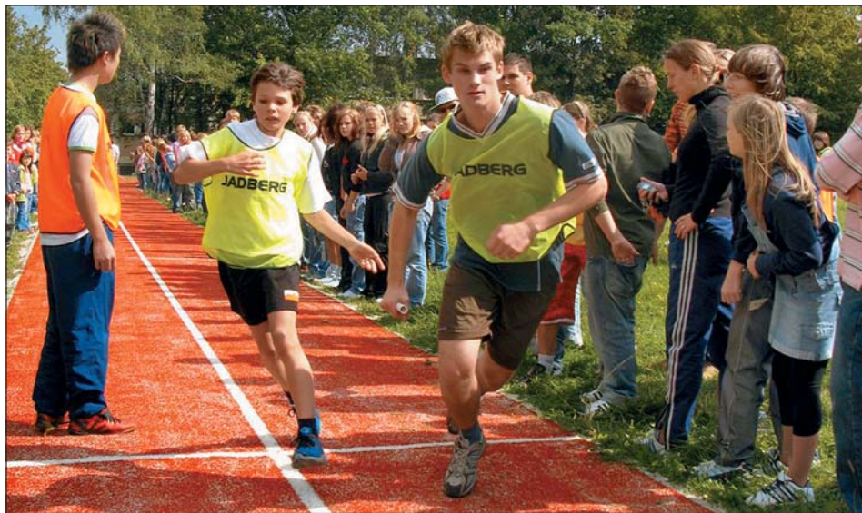
Znovuotevření atletické dráhy bylo zakončeno sprintem žáků gymnázia.

Po předloňském zprovoznění fotbalového minihřiště s umělým povrchem přibyl v areálu svitavského gymnázia další sportovní stánek. Škola nákladem 1,2 mil. korun zrekonstruovala atletickou dráhu. Na místě již nevyhovujícího původního škvárového oválu vybudovaly firmy Sibera System a EVT Svitavy v průběhu jara a léta novou dráhu s umělým povrchem. Dvoudráhu, která měří 250 m, lze využít pro běh na 400 nebo 800 m i na sprint (50 m, 60 m a 100 m). Součástí hřiště je také sektor pro skok daleký. Jak nám sdělil ředitel gymnázia Milan Báča, prostředky na rekonstrukci škola získala z vlastních zdrojů a díky grantu Pardubického kraje. Výstavbu hřiště podpořilo také město Svitavy. Zároveň dodal, že atletickou dráhu budou moci využívat nejen svitavské školy, ale také svitavští sportovci (fotbalisté, basketbalisté, volejbalisté apod.). Účast