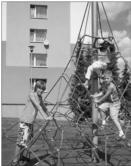
Sídliště Lány je obohaceno i o nové herní prvky pro děti.