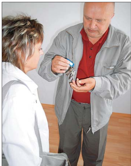
Předávání klíčů nájemcům.