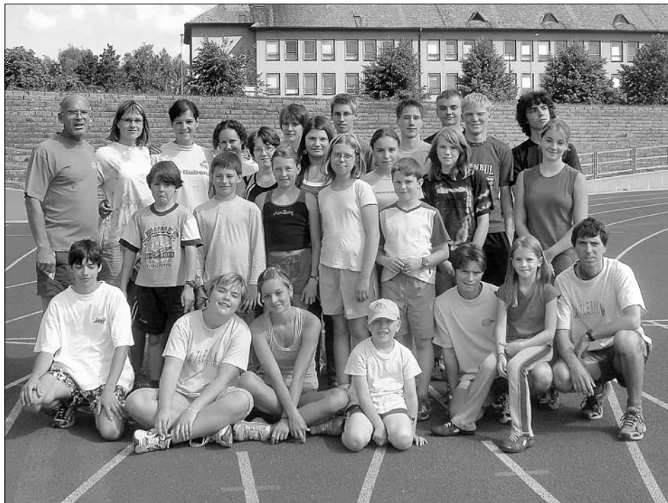
Skupina svitavských atletů na soustředění 2007.

Závaznou přihlášku a platbu startovného uskutečňte do 7. 9. 2007. Startovné je možné zaplatit převodem na účet číslo 0461735173/0800. Jako variabilní symbol uveďte datum narození. Další informace k závodu poskytne pan Kučera na telefonu: 603 812 414 nebo e-mailu: emp.kucera@unet.cz. -kv-