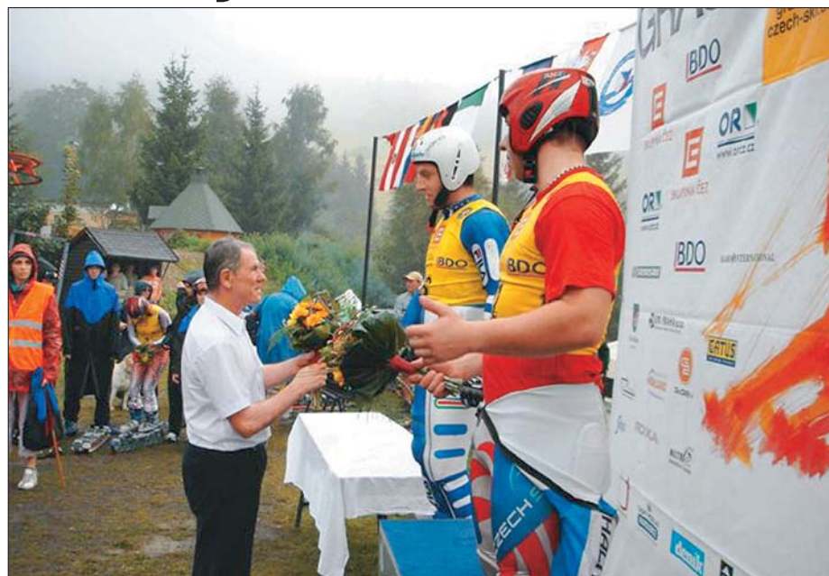
Světový pohár v travním lyžování viděli příznivci sportu v srpnu v Čenkovicích. Po skvělých výkonech předávali ocenění za umístění v soutěži radní i senátor Václav Koukal.