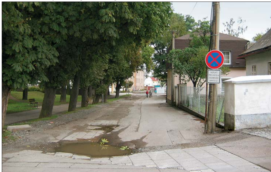
Současný stav Wolkerovy aleje je neutěšený. Projekt revitalizace pěší zóny a parku naváže na exteriéry Fabriky a vytvoří logickou vazbu na historické náměstí.