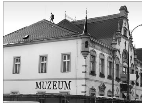
Rozsáhlá rekonstrukce střechy stála město Svitavy 1,3 mil. Kč.

Kompletní opravou prošla v měsíci říjnu střecha budovy Městského muzea a galerie ve Svitavách. Budova byla postavena v roce 1892. Ve stejném roce, jako naproti stojící Ottendorferova knihovna. V minulých letech získalo muzeum novou fasádu. Střecha památkově chráněné části budovy muzea však byla opravována po částech, zejména při zatékání. V důsledku toho byla střecha vytvořena z velmi nesourodých materiálů, jako je například měď a hliník. Střecha také trpěla mnohými netěsnostmi. Voda pronikala do podstřeší a způsobovala opakované masivní zatékání do prostor muzea v různých částech budovy. Zastupitelstvo města se proto rozhodlo uvolnit peníze na celkovou opravu střechy, která vrátila budově muzea historický ráz.