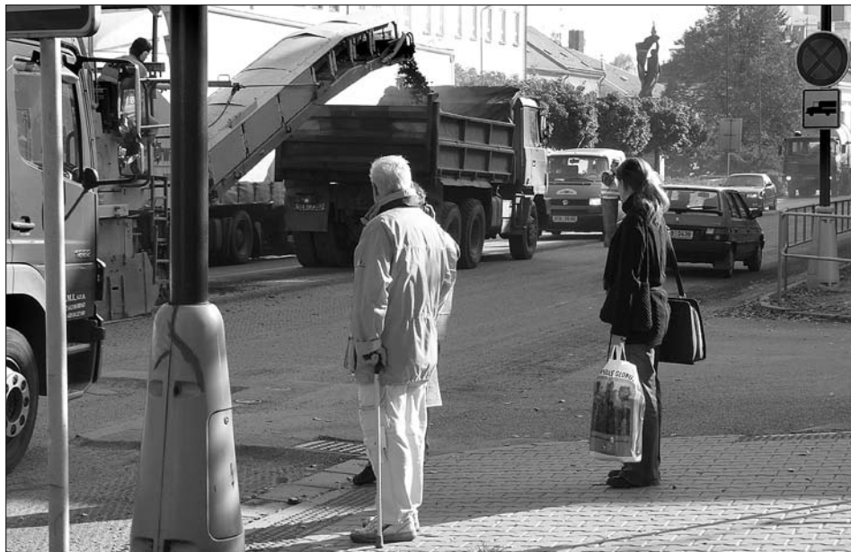
Rekonstrukce povrchu silnice v centru města způsobuje dopravní komplikace. V období úplné uzavírky od 22. 10. do 4. 11. budou na objížďné trase posíleny hlídky policie u škol a dalších míst, kde se pohybují děti.